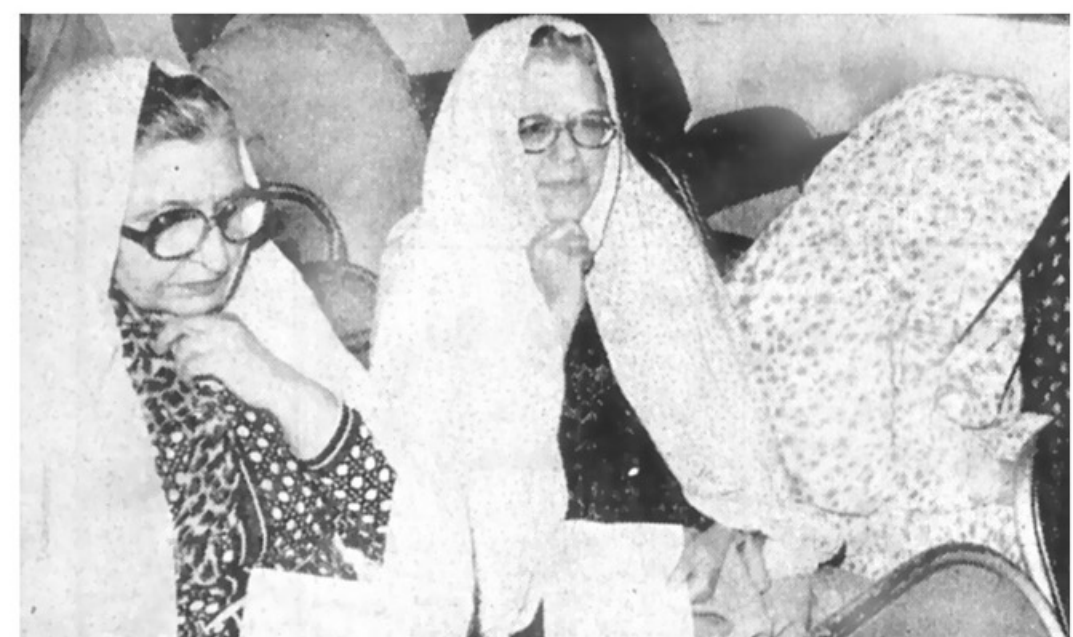
سناتور سابق شوکت الملوک جهانیان وکیل سابق بیرونی در سالن دادگاه انقلاب اسلامی ، دیگر نمایندگان زن نیز با چادر دیده می شوند.

✱ حساسیت ایران ، امروز بیش از روزی است که مردم را برای مبارزه بسیج کردیم ✱ طرح مسائل فرعی باعث میشود نهبست شکست بخورد در صفحه ۱۱