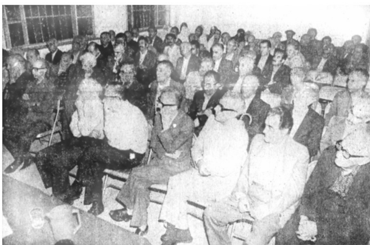
۲۰ تن از نمایندگان سابق مجلسین ، بعد از ظهر دیروز در سالن دادگاه انقلابی ، اجتماع کردند و دادستان انقلاب تهران ، پیام عفو امام خمینی و شرایط آزادی آنان ابلاغ کرد .

رم - خبرگزاری ها سیو شش نفر از دانشجویان ایرانی مقیم ایتالیا بعنوان اعتراضیه حضوره اشخاص وابسته به رژیم شاه مخلوع در سفارت ایران در پایتخت ایتالیا دست باعتصاب غذا زدند . دانشجویان اعتصابی ضمن اعلامیهای خواستار اخراج این عده از سفارت و لغو همه قوانین غیر اسلامی و زینت مشاه سابقه مخصوصا مقررات درباره دانشجویان ایرانی-مقیم خارج شده اند . دانشجویان ایرانی همچنین مداخله پلیس ایتالیا را در کنسولگری ایران در رم برای بازجویی از اعتصابیون - و بازرسی هویت آنها محکوم کردند . دانشجویان گنند دهها سال در ایران قوانین به خواست شاه و بسنگاشتن تنظیم و تصویب میشد ، یعنی هرکاری را که منافع آنها اقتضا میکرد و با ابرایشان شهرت بوجود می آورد و برای مردم تشنه انقلاب بمنزله مسکن موقت بود همه صورت قانون و بدون رعایت باید فوراً تجدید نظر شوند و قوانین غیر مفید ابطال و بقیه اصلاح شوند . دانشجویان همچنین معتقدند که سفارتخانه ، کنسولگریها و سایر نمایندگی های ایران در خارج نه تنها از ساواکها و عوامل شاه مخلوع بلکه از نورچشمی ها و آنها که در سابق با پارتی بازی و بدون استحقاق مشاغل ، کارها را اشغال کرده اند پاکسازی شوند .