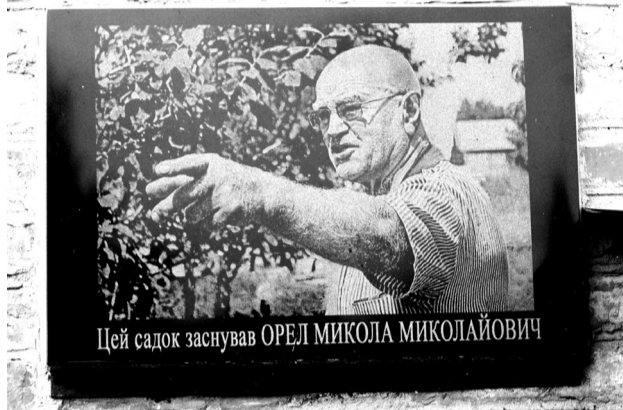
Меморіальна дошка на приміщенні заготівлі, переробки й зберігання продукції