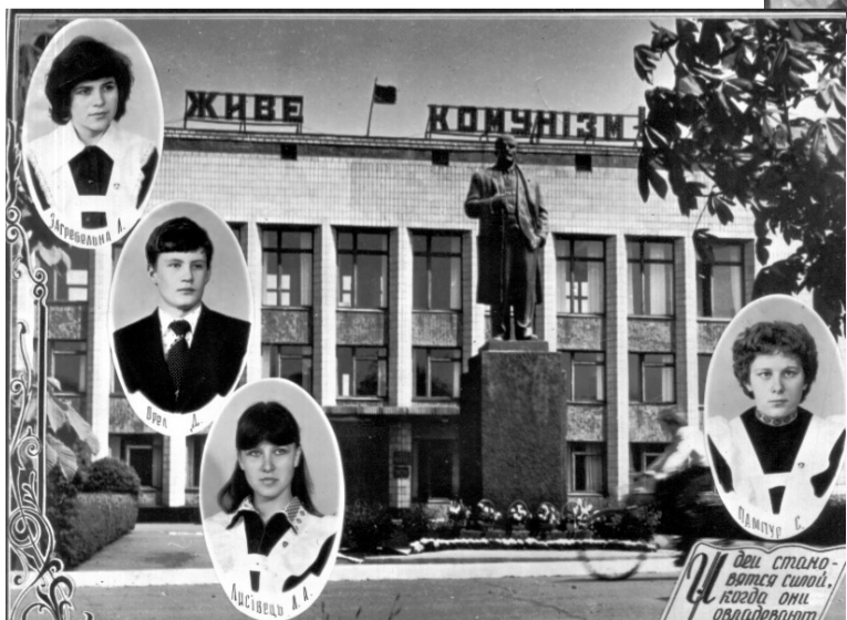
Прощай, Козельщинська школо!