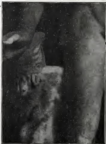
ABB. 2. DETAIL VOM APOLL VON BELVEDERE