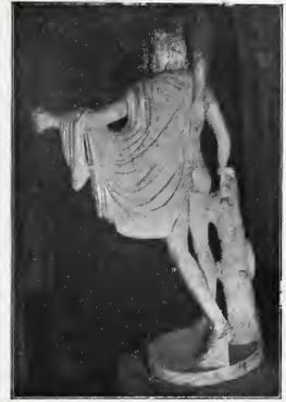
ABB. 4. APOLL VON BELVEDERE

Daß also beide Figuren auf dasselbe Original zurückgehen, wird jetzt wohl allseitig zugegeben werden. Was lehrt uns nun das pompejanische Bild, oder mit anderen Worten, welche Abweichungen vom Apoll von Belvedere sind als ursprünglich schon in der Vorlage vorhanden anzusehen, und welche sind auf das Bestreben des Malers zurückzuführen, den vorhandenen statuarischen Typus für seine Komposition umzugestalten? Daß die Haltung des linken Armes vielleicht etwas durch den höher gelegenen Standpunkt des Malers mit beeinflußt wurde, ist oben er-