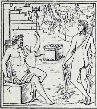
ABB. 3. POSEIDON, MAUERN BAUEND POMPEJANISCHES WANDGEMÄLDE

vedere sowie der Apollo des pompejanischen Wandgemäldes sind hier unter Nummer 3 und 4 zusammengestellt.