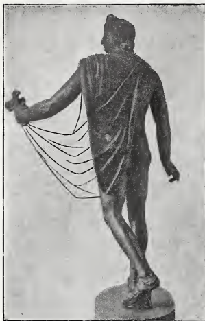
ABB. 1. APOLLO STROGANOFF RÜCKENANSICHT