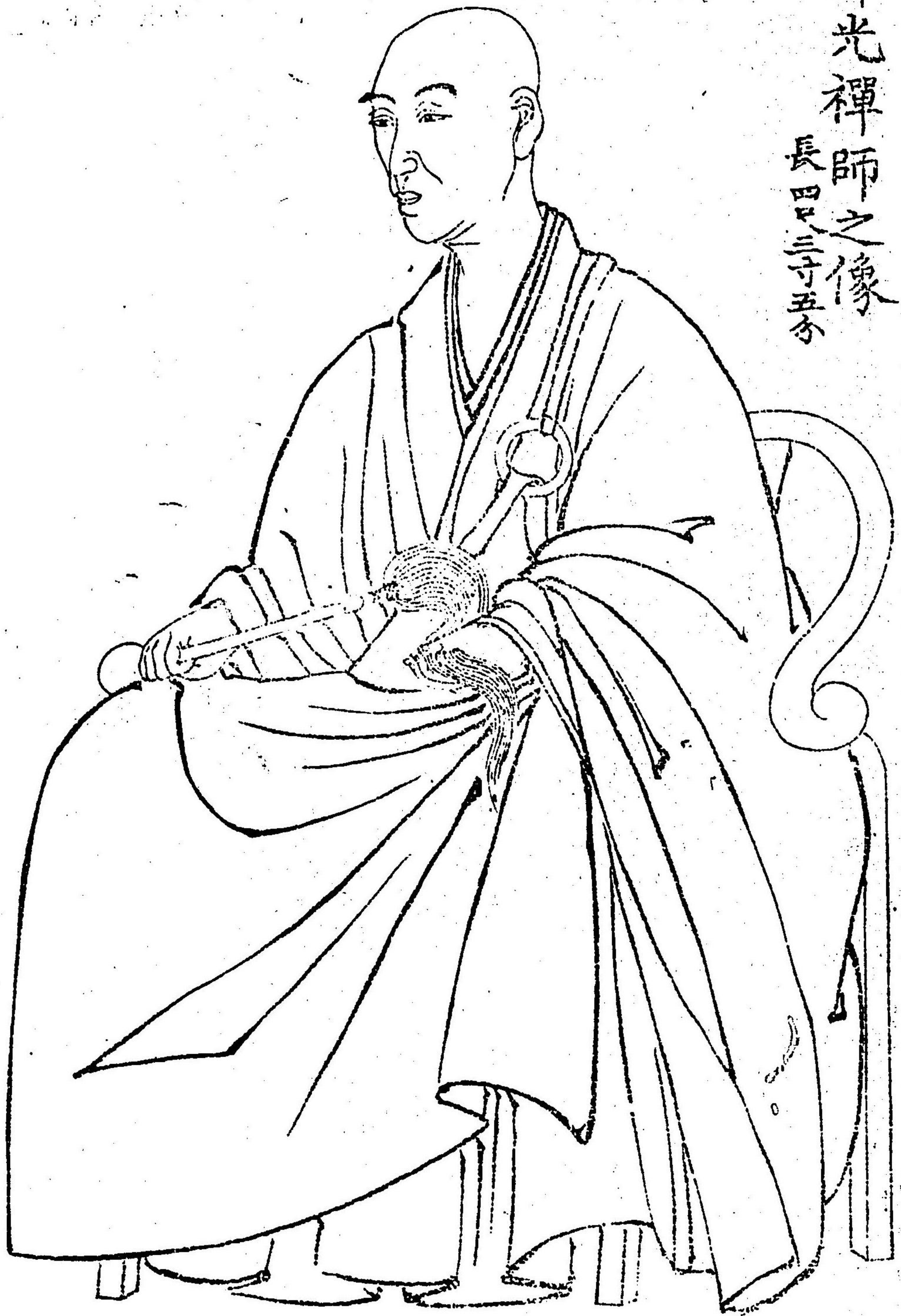
佛光禪師之像 長四尺三寸五分