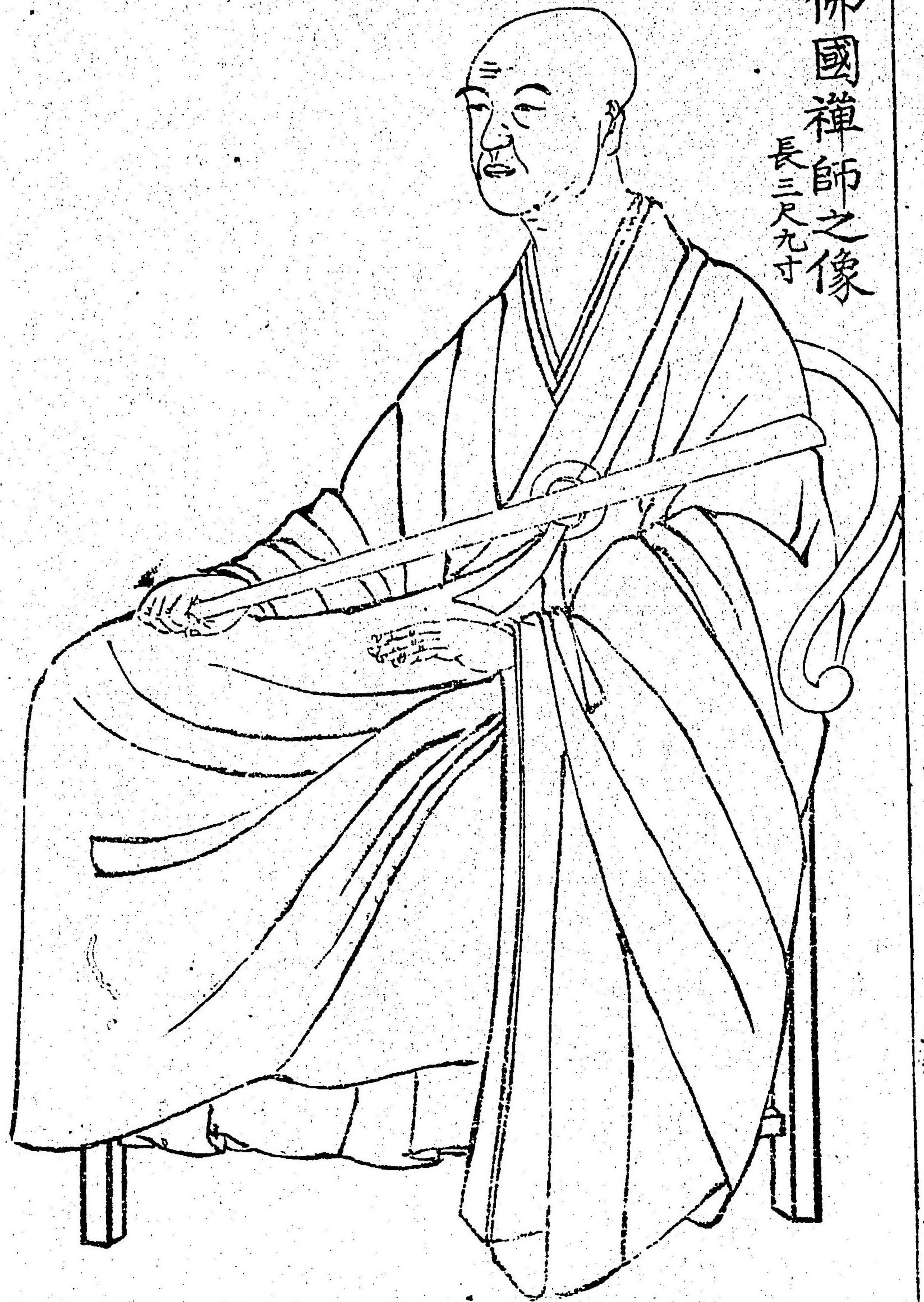
佛國禪師之像 長三尺九寸