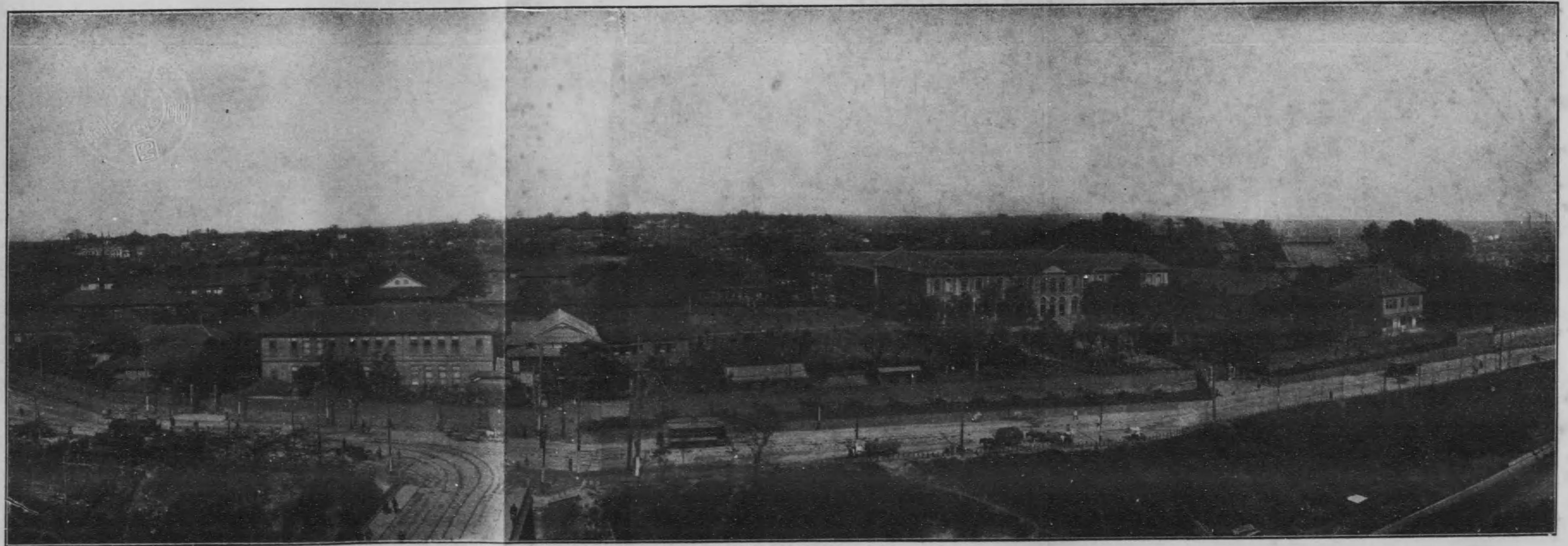
東北京女子高等師範學校全景