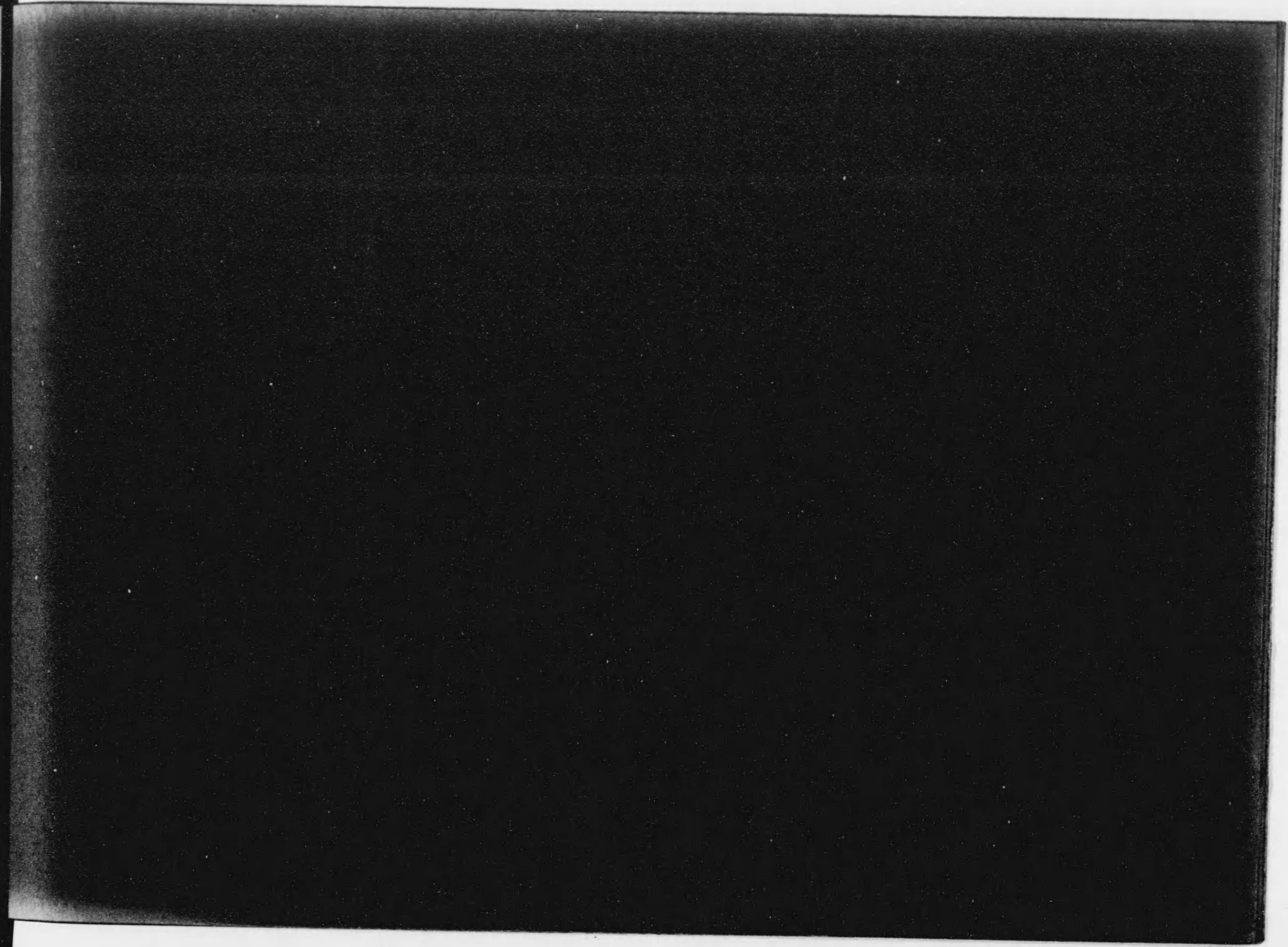
Table of contents or index page with faint text and horizontal lines.