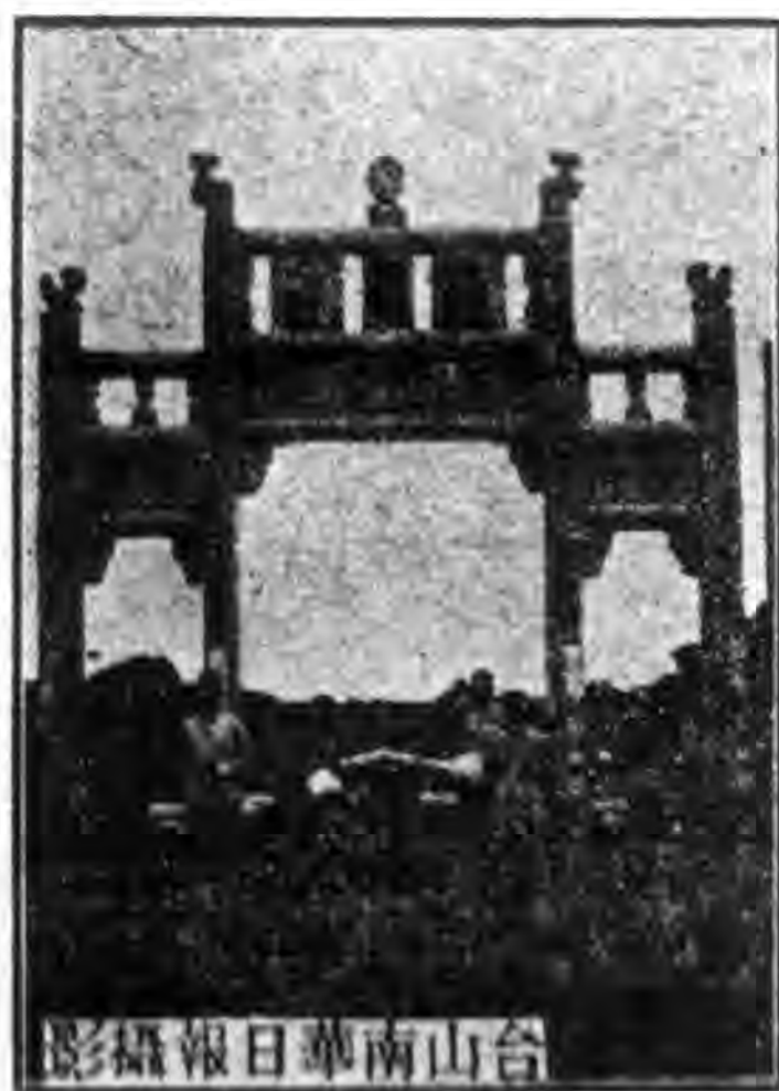
廣海彭烈女大孃旌表石坊