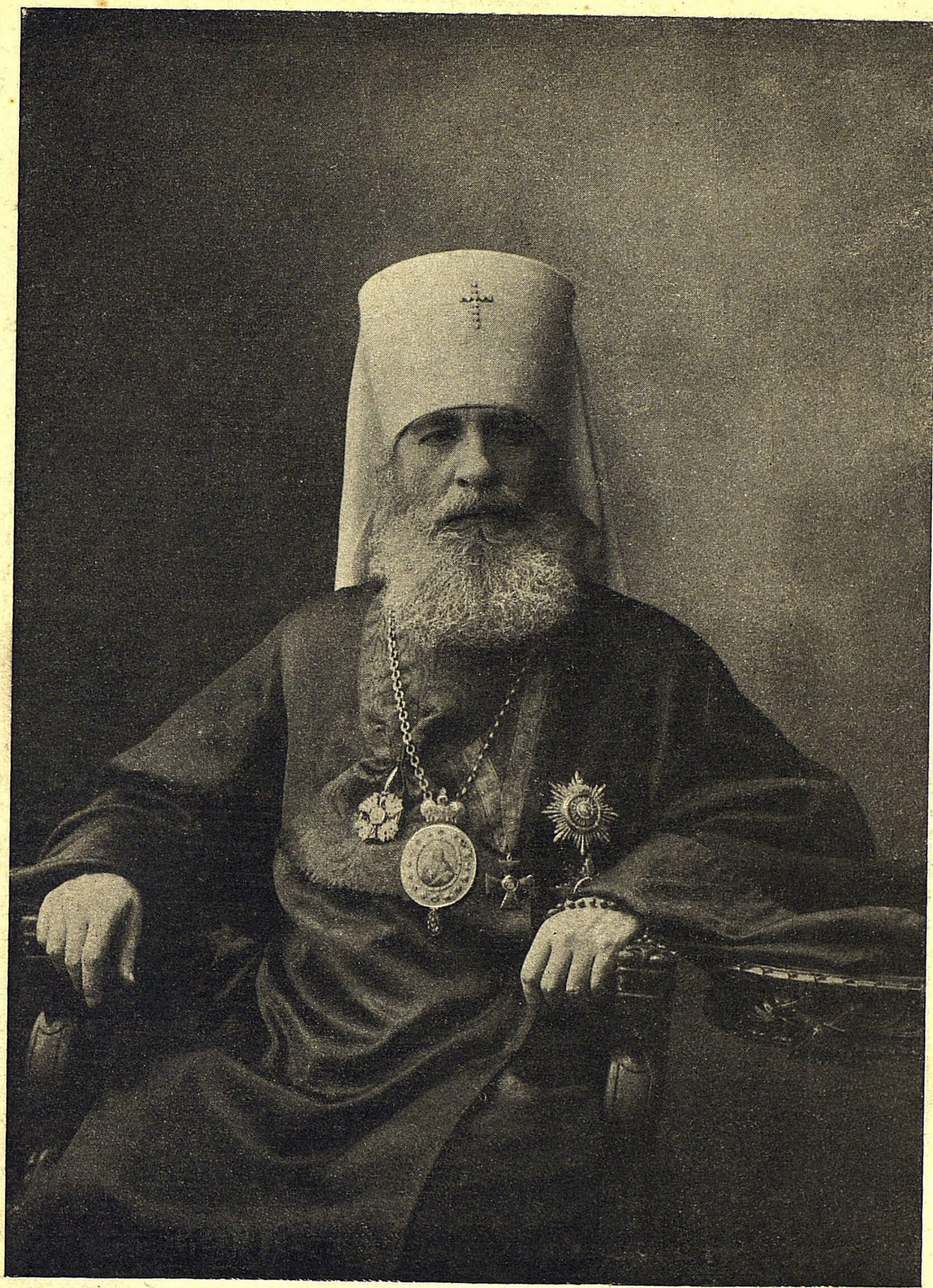
Аммоніи Митрополита С. Северодвинскіи и Ладозскіи