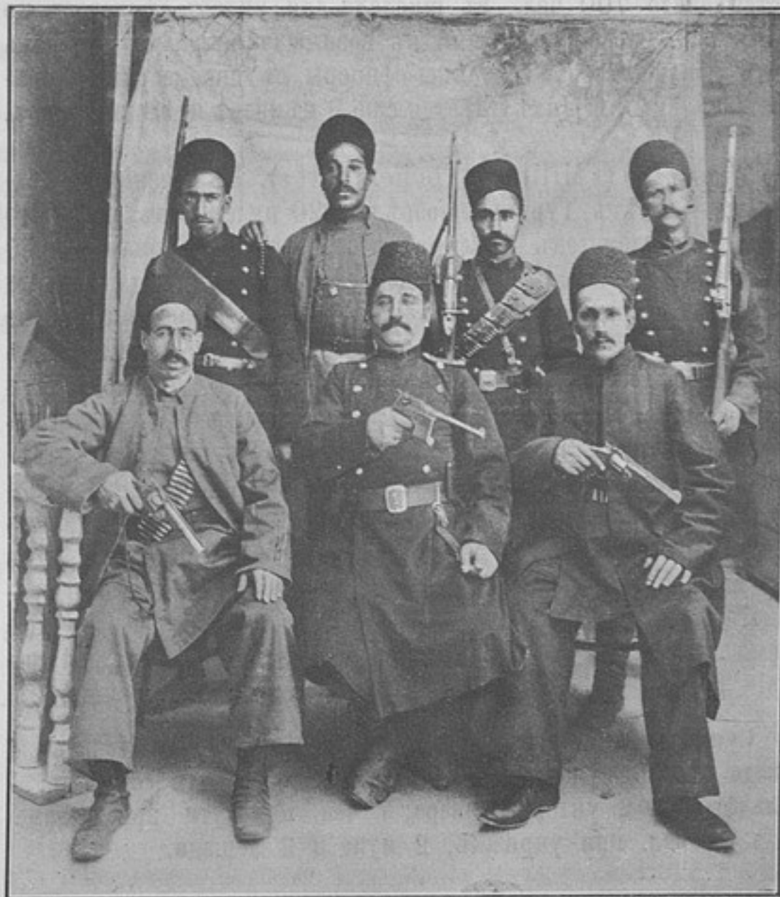
Полиція въ Тавризѣ. (Къ кор. «Тавризъ».).

Японія («The Army and Navy Gaz.»). Принятыми соответствующими мѣрами значительно устраненъ недостатокъ унтеръ-офицеровъ, только на островѣ Хоккаидо и на Формозѣ комплектъ даетъ себя еще знать. Увеличеніе числа унтеръ-