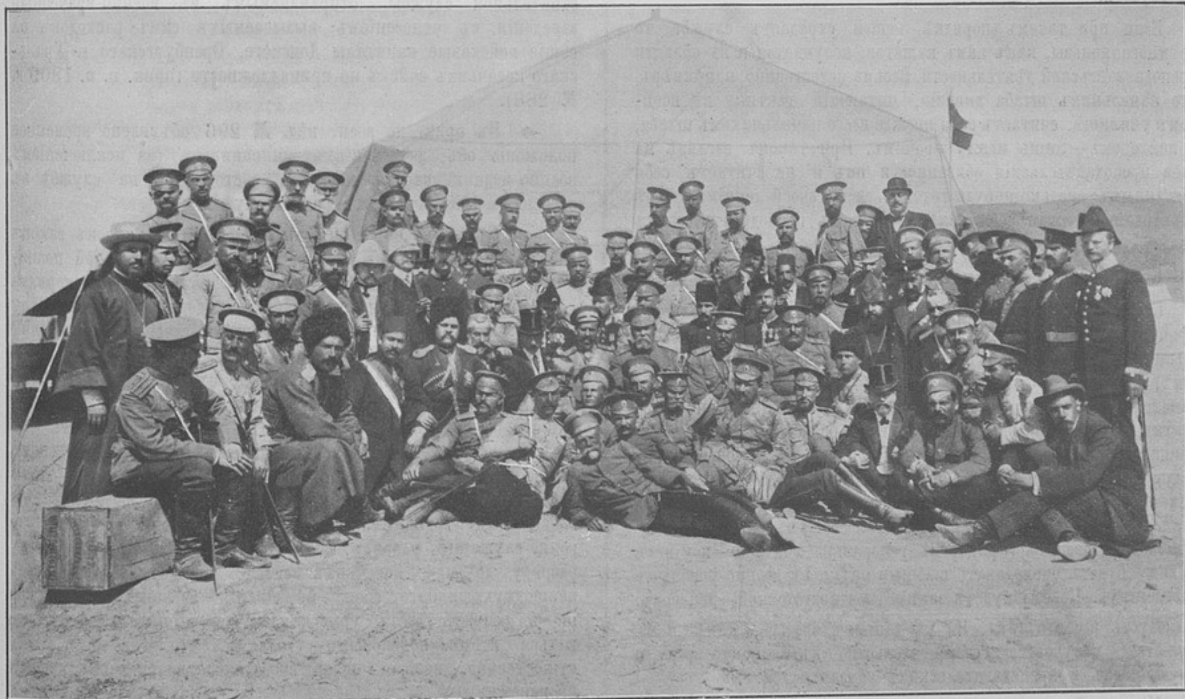
Офицеры Тавризскаго отряда, россійскій и иностранные консулы (23-го апрѣля послѣ парада). (Къ кор. «Тавризь»).

Строго говоря, этотъ вопросъ стоитъ также въ нѣкоторомъ соприкосновеніи съ реформой большого масштаба—съ реорганизацией подготовки и службы корпуса офицеровъ генеральнаго штаба, который принято называть «мозгомъ арміи». Но такъ какъ объ этой реформѣ въ свое время немало говорилось и писалось,