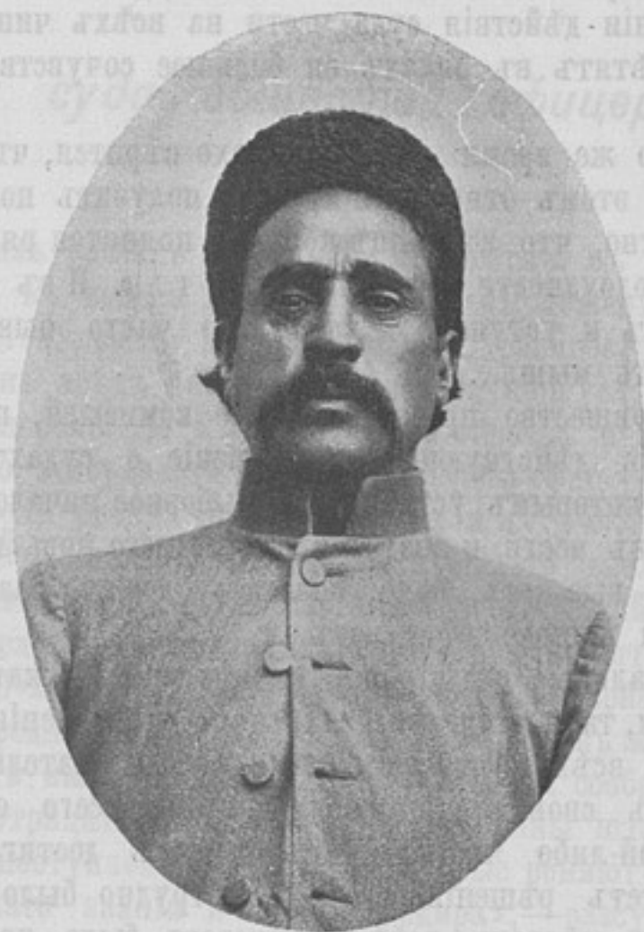
Сатаръ-Ханъ. Вождь революціонеровъ въ Азербайжанѣ, (нынѣ скрывающійся въ бѣствѣ турецкаго консульства въ Тавризѣ). (Къ кор. «Тавризь». Изъ альбома прапорщика князя Г. Д. Черкесова).

Въ номерѣ 974 «Развѣдчика», въ «Обзорѣ печати» (стр. 381), помѣщена довольно лестная замѣтка объ издающемся при штабѣ Варшавскаго военнаго округа журналѣ: «Свѣдѣнія изъ области военнаго дѣла за границей». Между прочимъ авторъ замѣтки сѣтуетъ на то, что въ № 16 журнала не приведенъ источникъ, изъ котораго почерпнутъ матеріалъ для обширной статьи Альтрока о военной игрѣ и даже не упомянуто, переводная ли это статья или самостоятельный трудъ. Очевидно къ автору замѣтки попалъ случайный экземпляръ, такъ какъ въ лежащихъ передо мной, на примѣръ, №№ 13—16 журнала, въ каждомъ номерѣ, передъ каждой изъ частей этой статьи по-