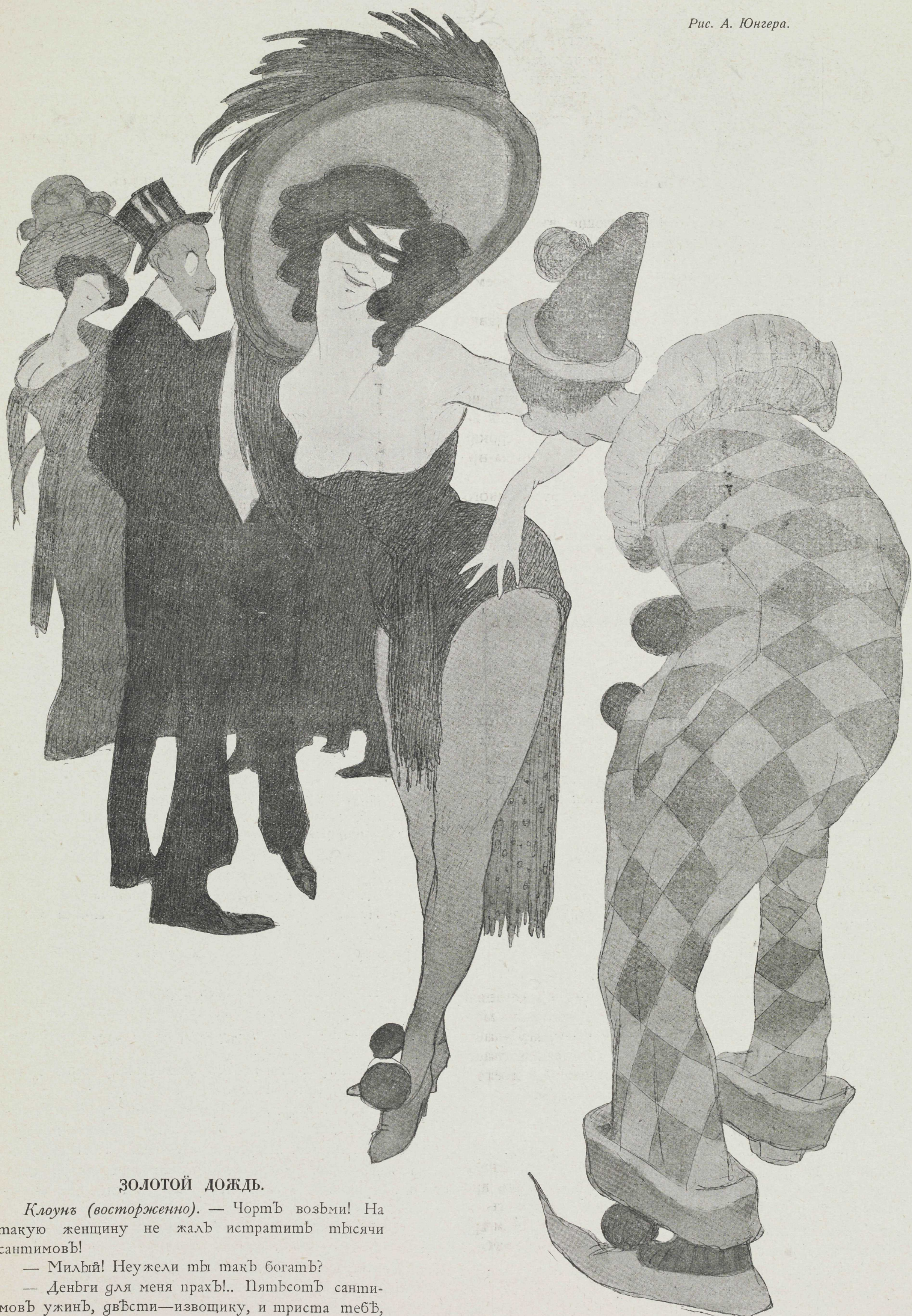
Рис. А. Юнгера.