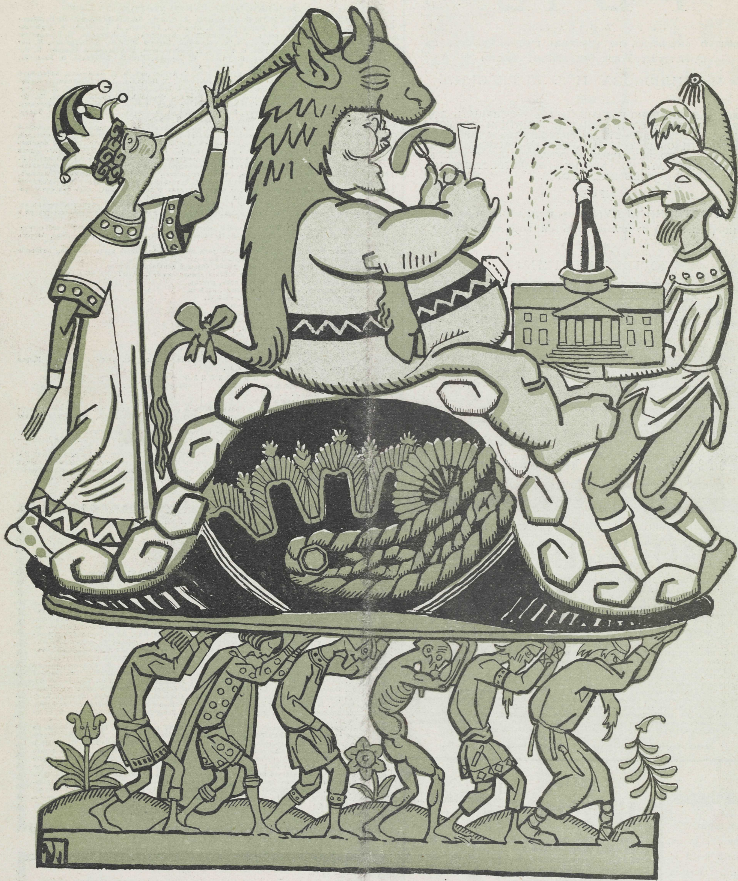
Торжественное масленичное шествіе Всеросійскаго Зубра по лицу любезнаго отечества.