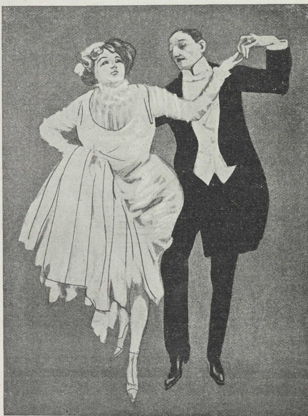
Рис. „Lustige Blätter“.

— Но, mesdames, вы кажется такъ добры, что послали въ Мессину даже вашу послѣднюю рубашку.