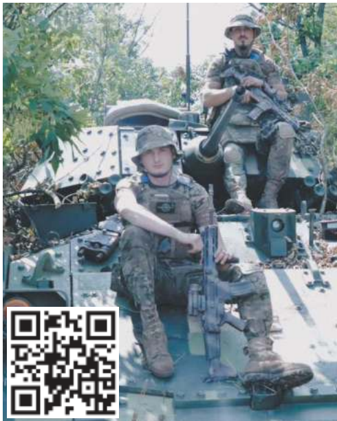
На фото на тому самому Bradley сидять зліва направо: навідник «Примара» та командир бойової машини «Кач». Механік-водій «Бублік» під час фотографування був на завданні. Тож його портретна світлина зроблена трохи пізніше.

Воїни 47-ї бригади з позивними «Примара», «Кач» та «Бублік» на своєму «Бредлі» працювали на Запорізькому напрямку. Цього разу бойову машину спочатку обходила з двох боків російська піхота. А коли окупантів знищили автоматичною гарматою, росіяни оголосили справжнє полювання на українську Bradley. Ворог терміново ввів у бій пару Т-72. Обидва російські танки було одразу спалено. Bradley оснащений важкою протитанковою ракетою TOW (Tube-launched Optically-tracked Wire-guided), якою вміло скористався екіпаж.