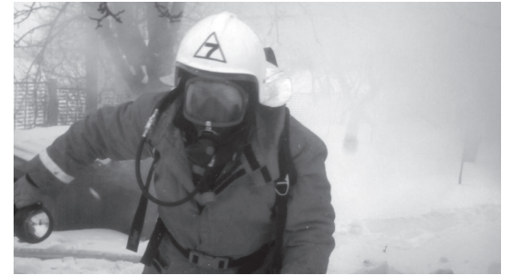
Решетилівка поблизу с. Хорішок. У мікроавтобусі знаходилося дві особи.

Того ж дня , об 18 год. 32 хв., підрозділ допо-міг витягнути мікроавтобус зі снігового замету на проїжджу частину автодороги Кременчук —