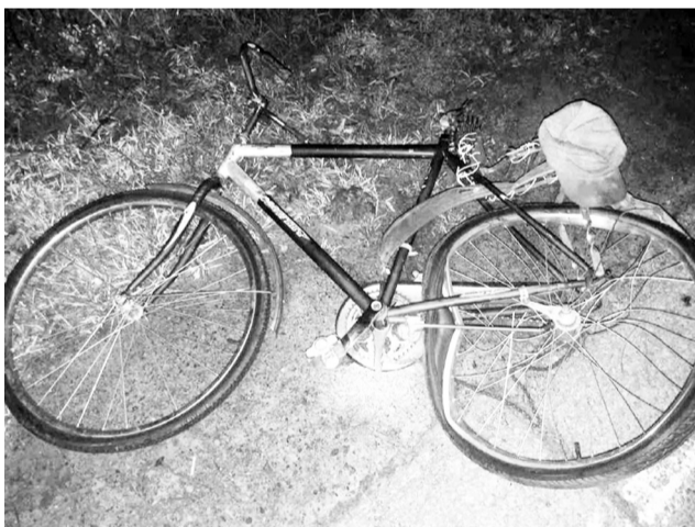
Макарівське ВП Ірпінського ВП ГУНП в Київській області.

У зв'язку із чим закликаємо всіх учасників дорожнього руху дотримуватись ПДР України, проявляти гуманність та повагу до інших учасників, а також відповідально ставитися до свого особистого життя і здоров'я!