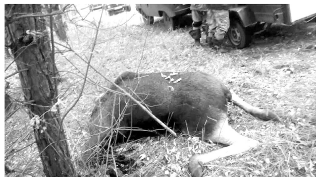
Головне управління Національної поліції в Київській області.

Це вже другий випадок за тиждень у районі, коли тварина потрапила під колеса автотранспорту. Так, кілька днів тому аналогічна ситуація сталася поблизу Житомирської траси, на узліссі. Того разу тварина залишилася жива.