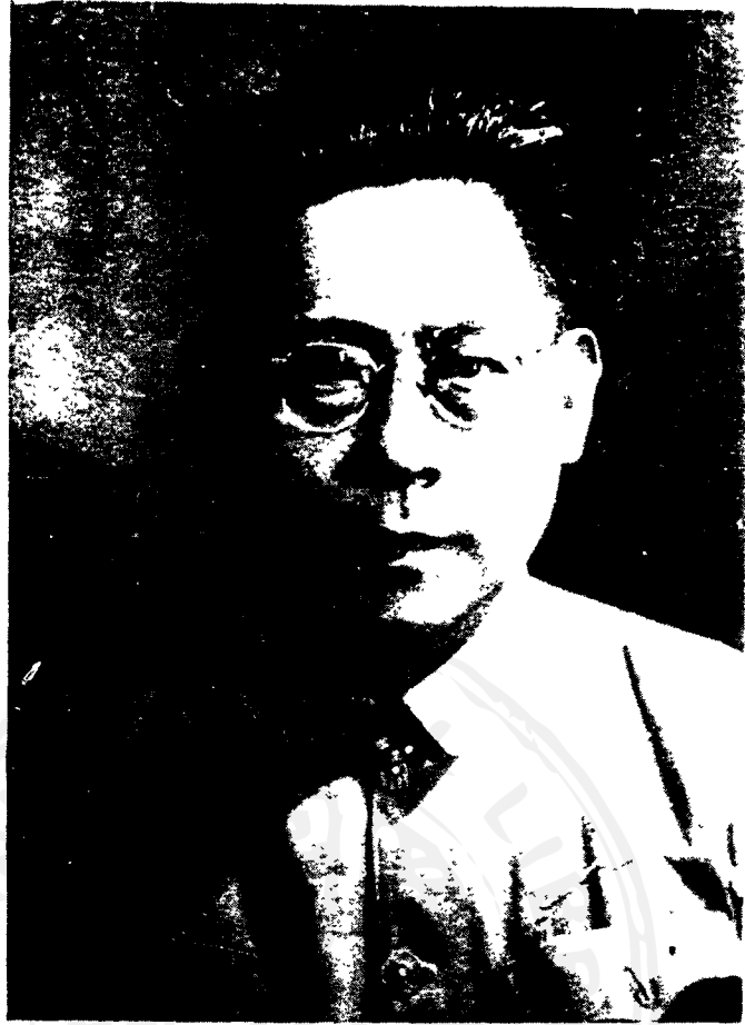
影 表 像 影