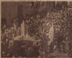
形情時門大出移體遺雄聖