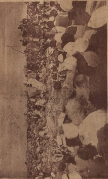
甘地之子於火葬後第三日爲聖雄收灰