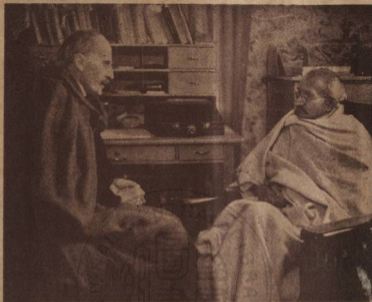
士瑞于攝年一三九一蘭羅曼羅與地甘