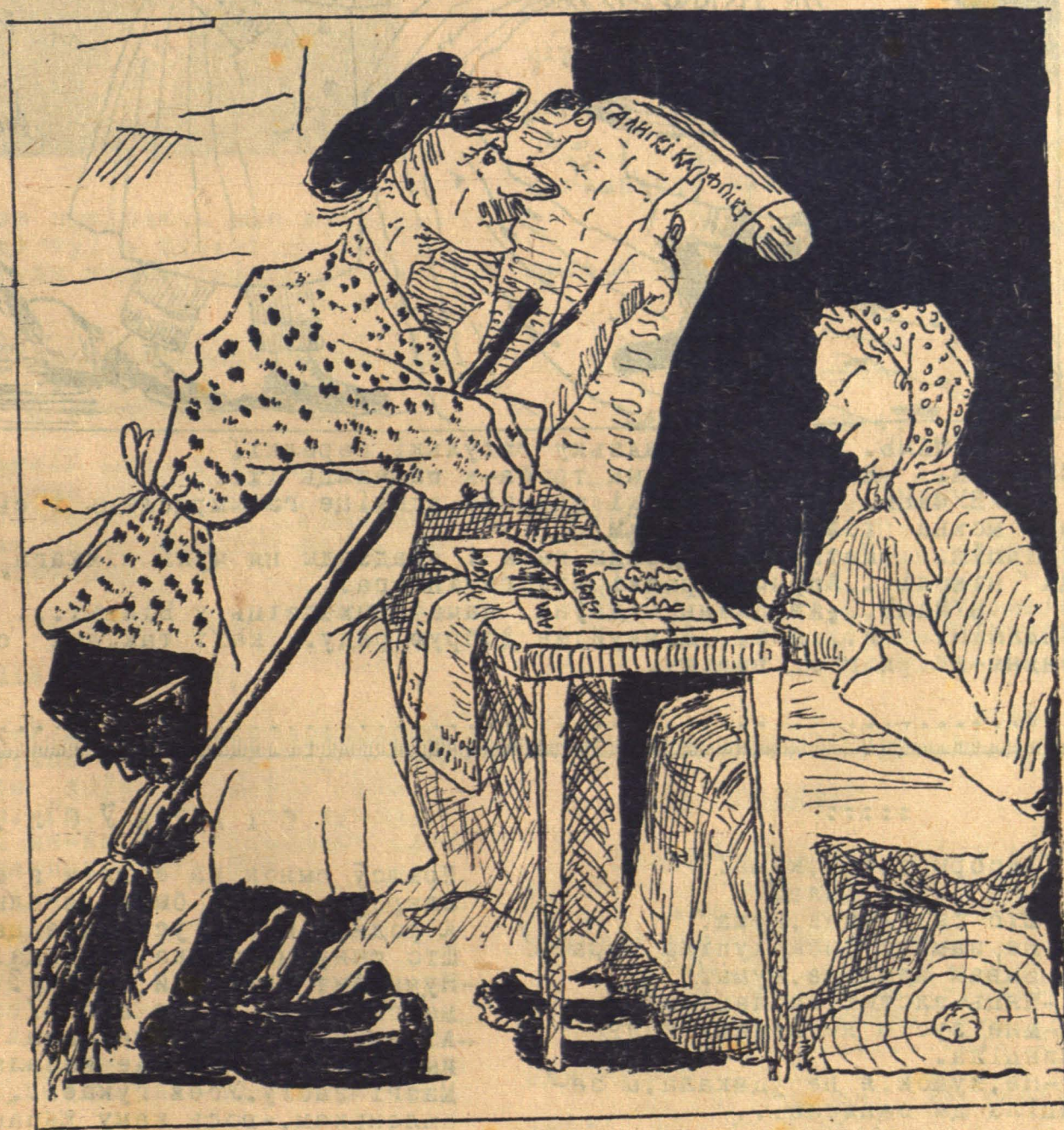
—Што гэта. Скрамніскі... скрынкі... —Зусім слушна: як цяпер міністр Скрамніньскі, дык у Гданску вісяць скрынкі, а як будзе Недзялкоўскі Ежы, дык прылу- ча да Мацехы.