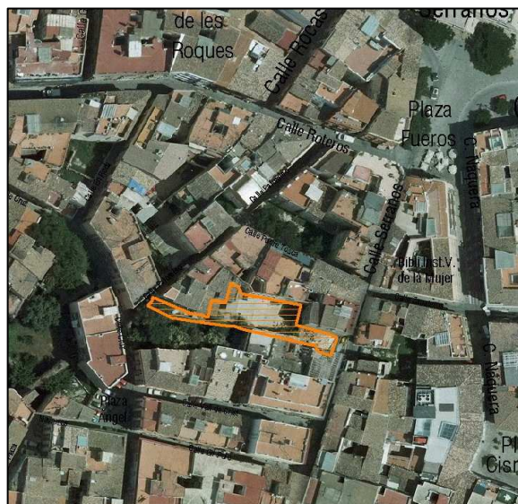
Foto aérea 2008 SIGESPA con ámbito arqueológico propuesto o refugio