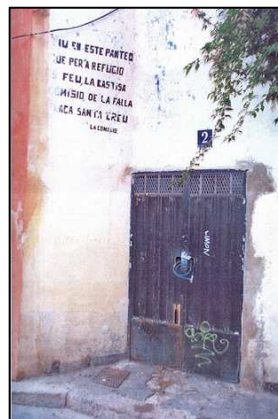
Acceso Calle Palomino