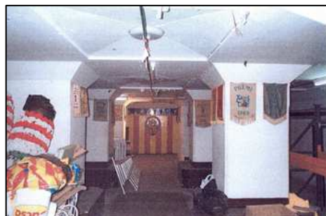
Vista del refugio cuando era casal fallero