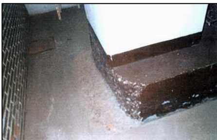
Banco para asiento adosado al pilar