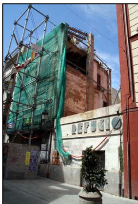
Acceso calle Serranos