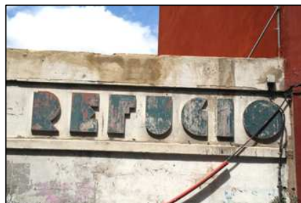
Estado actual de las letras de anuncio del refugio