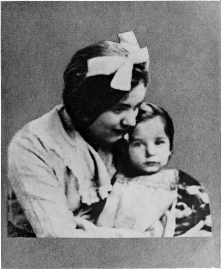
EDITH STEIN UND ILSE GORDON