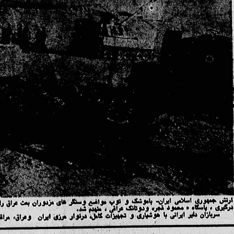
ارتش جمهوری اسلامی ایران - بانوشک و توپ مواضع و سنگر های مزدوران بعث عراق را درهم کوبید. در این تیرگی، پاسگاه «محمود نجفی» و دولتک عراقی، ملحد شد. سربازان دغیر ایرانی با خوشحالی و تجهیزات کامل درنواز هرز ایران و عراق، مراقب هرگونه حرکت دشمن هستند.

حجت الاسلام دعائی کارگران و کارمندان اطلاعات سر بازان با ایمان و وفادار امامند