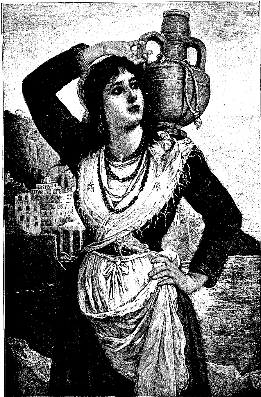
Italiancă aducând apa.