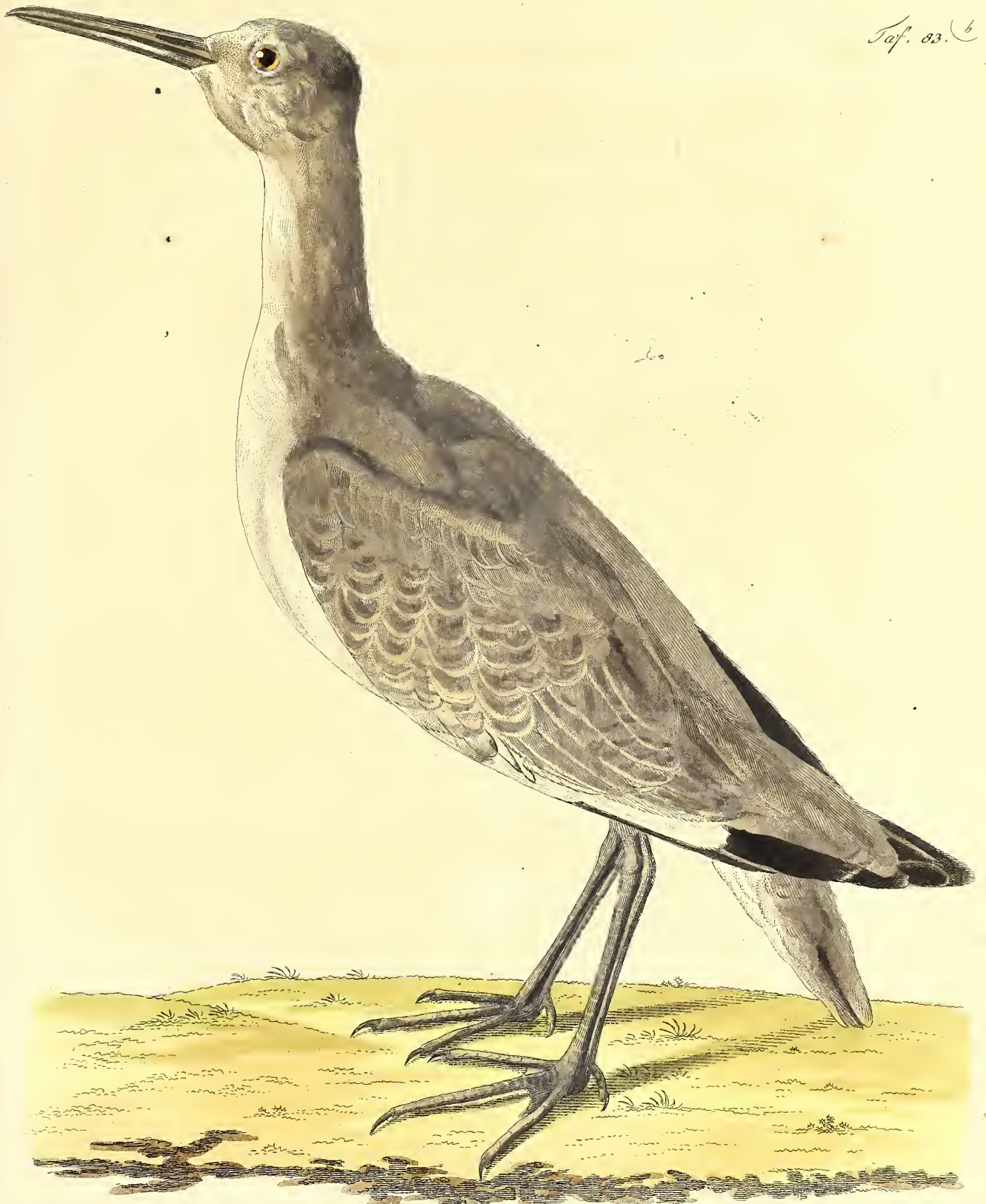
Die große Regenschneffe aus Amerika-