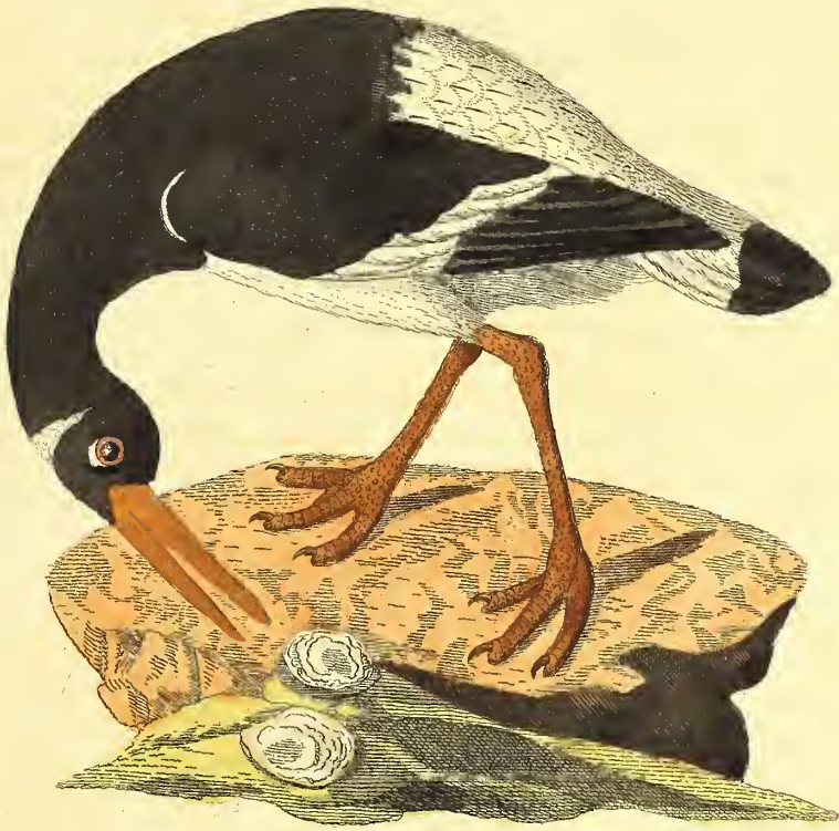
Der geschackte Austerfischer