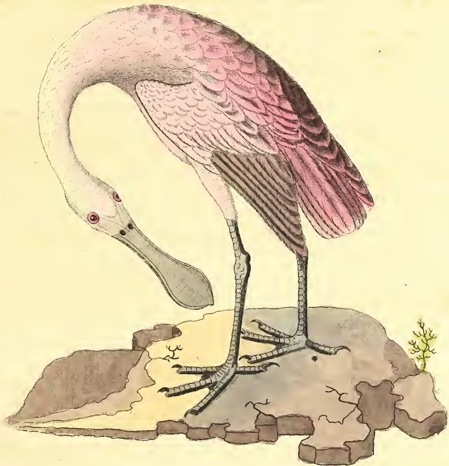
Der rosenrothe Löffelreher.