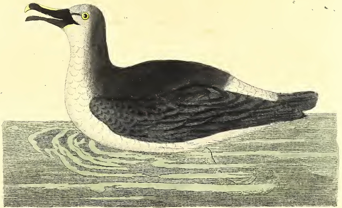
Der gelbnasige Albatross