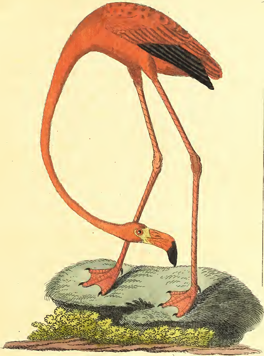
Der rothe Flammant.