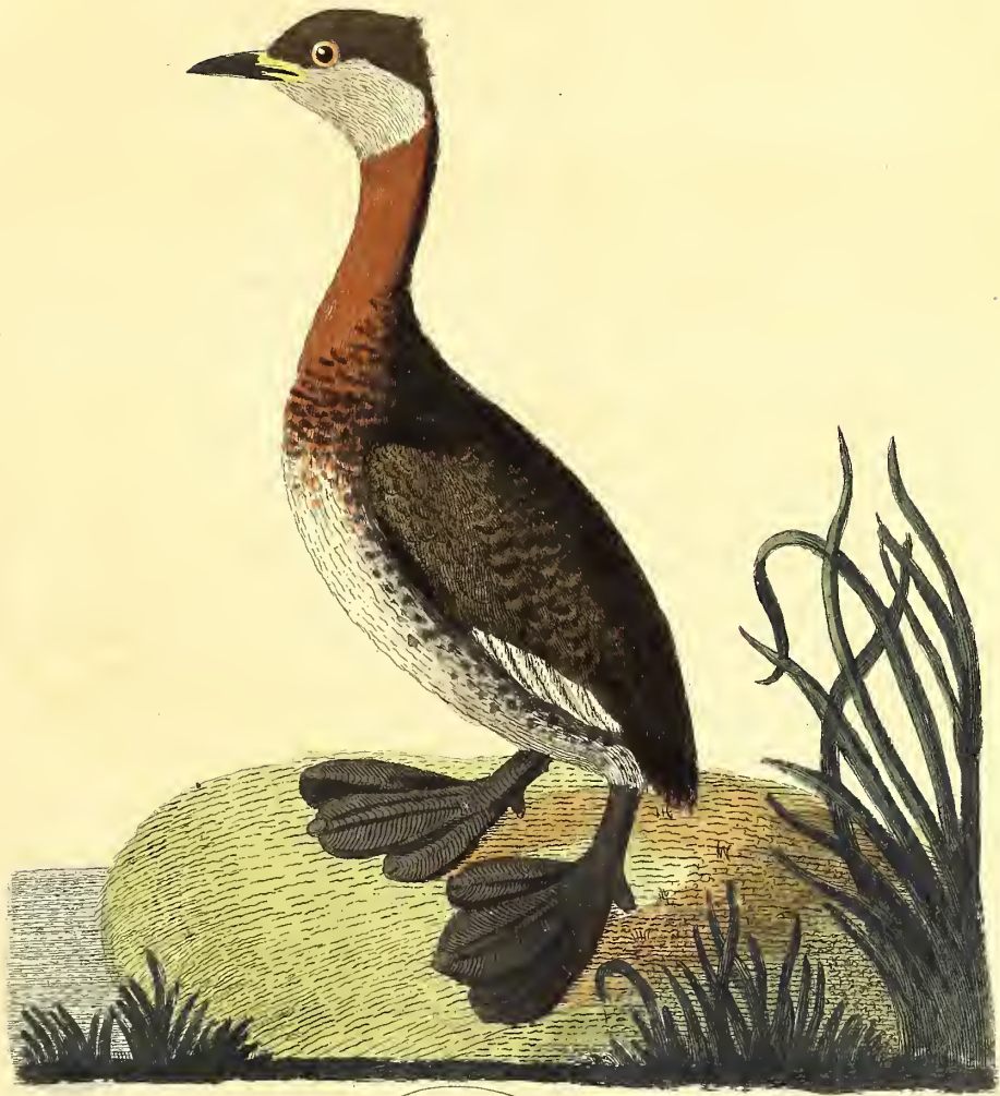
Der graukehliche Steiſſfuß.