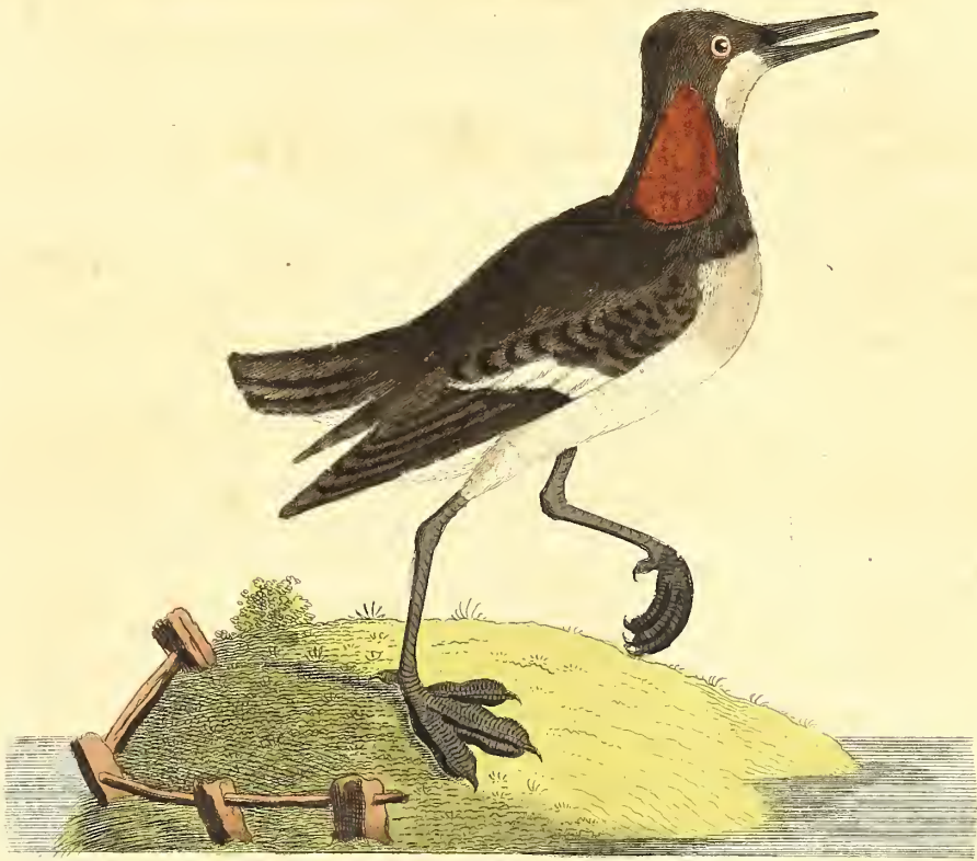
Das rothe Bastardwasserhuhn.