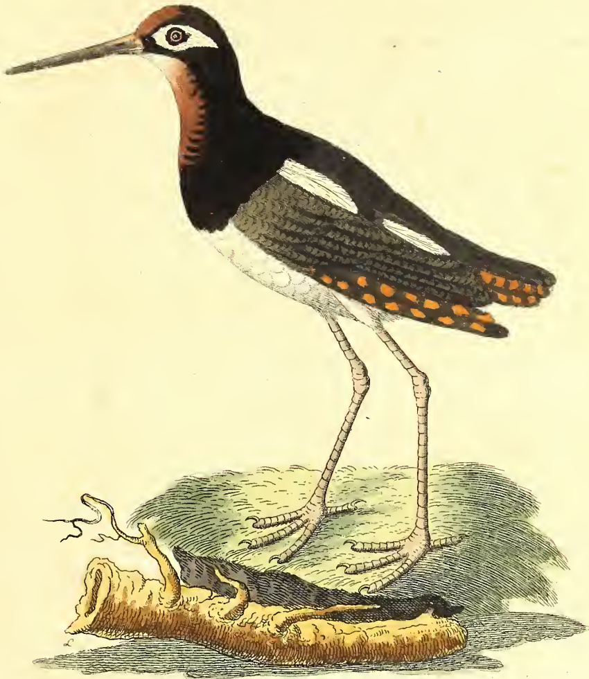
Die Capfche Schnepfe.