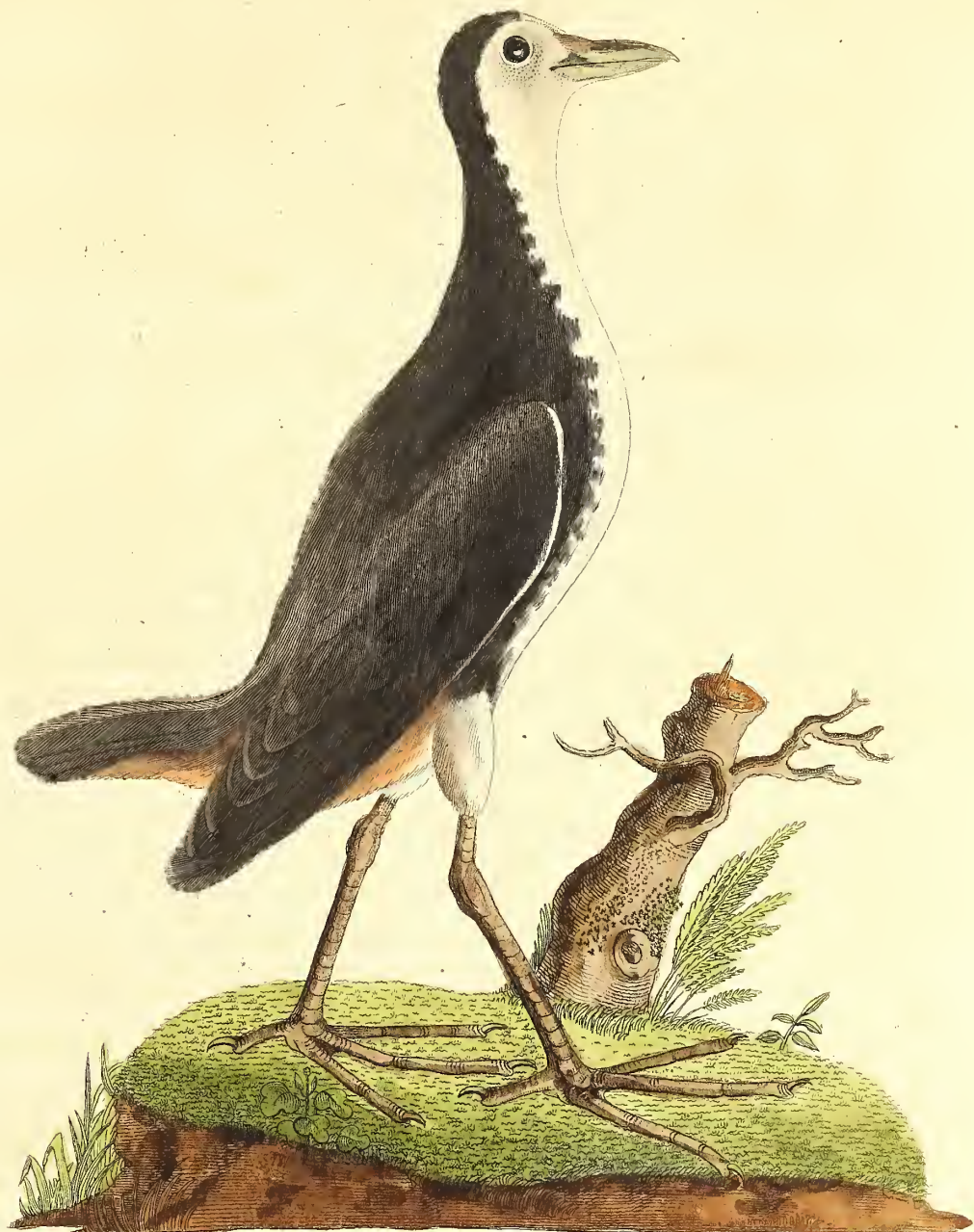
Das Meerhuhn mit rothen After