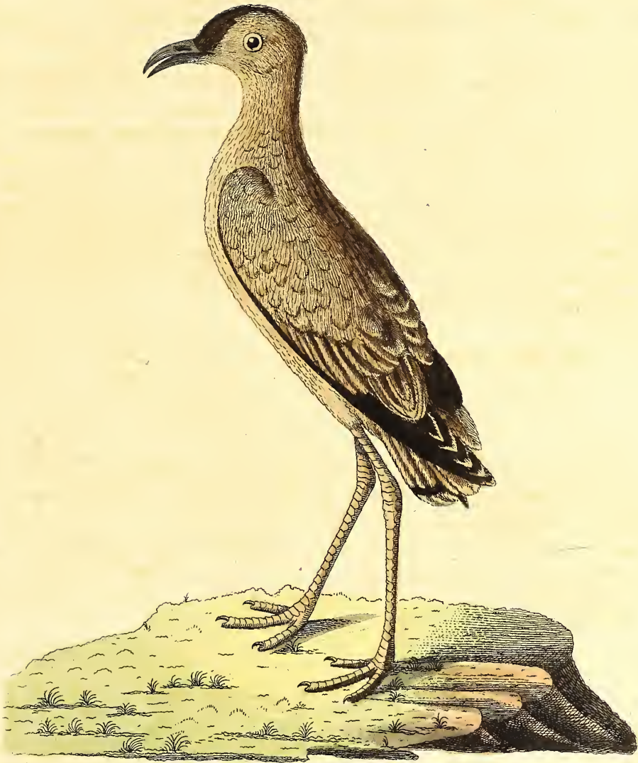
Der Französische Regenpfeifer.