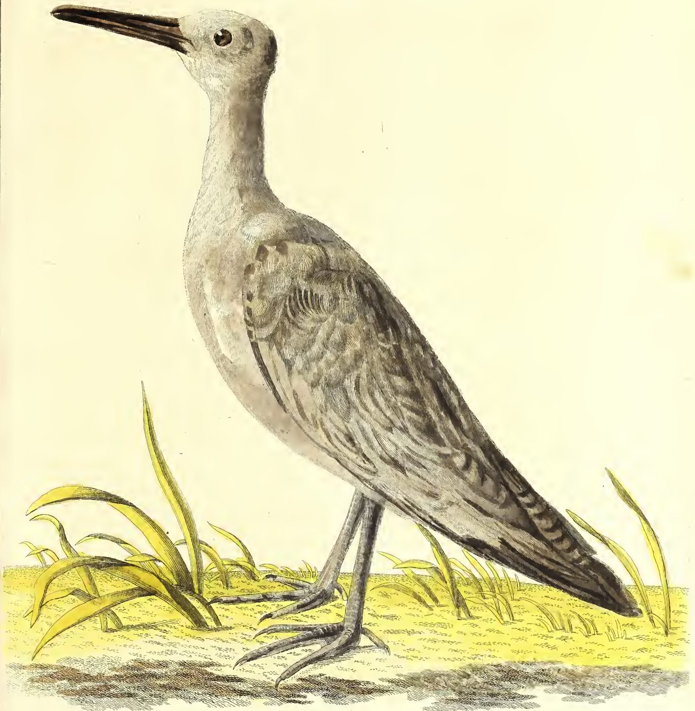
Die kleine Regenschepfe aus Amerika