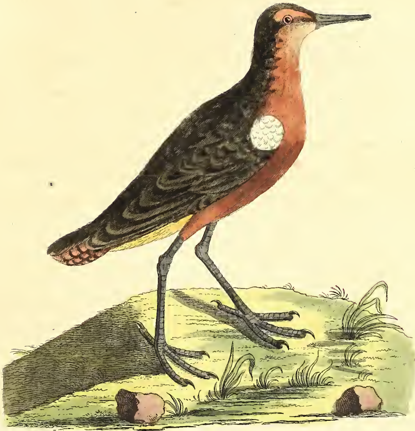
Der weissflügeliche Strandläufer.