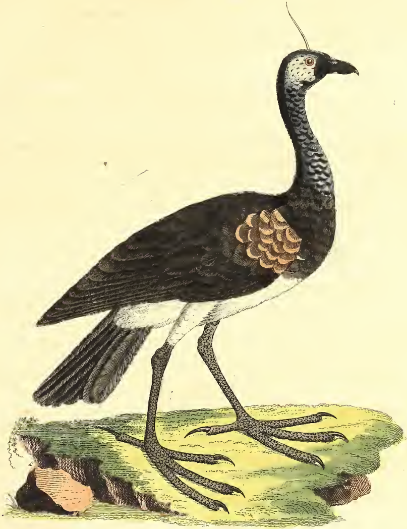
Der gehörnte Anhima.