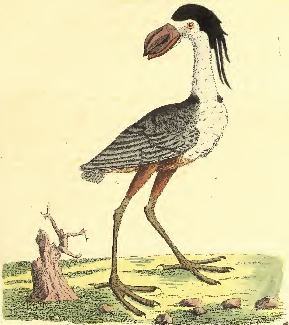
Der gehäubte Kohlschnabel.