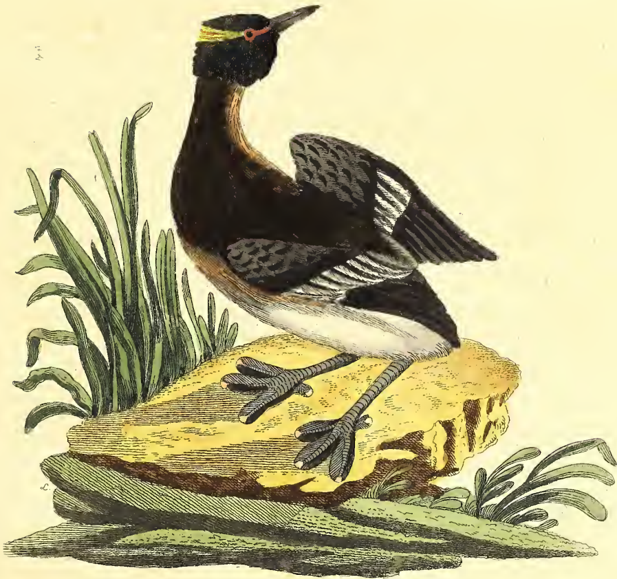
Der gehörnte Steiffuß.