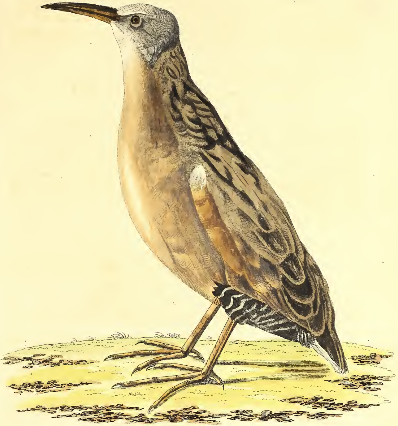
Die rothbrüstige Ralle