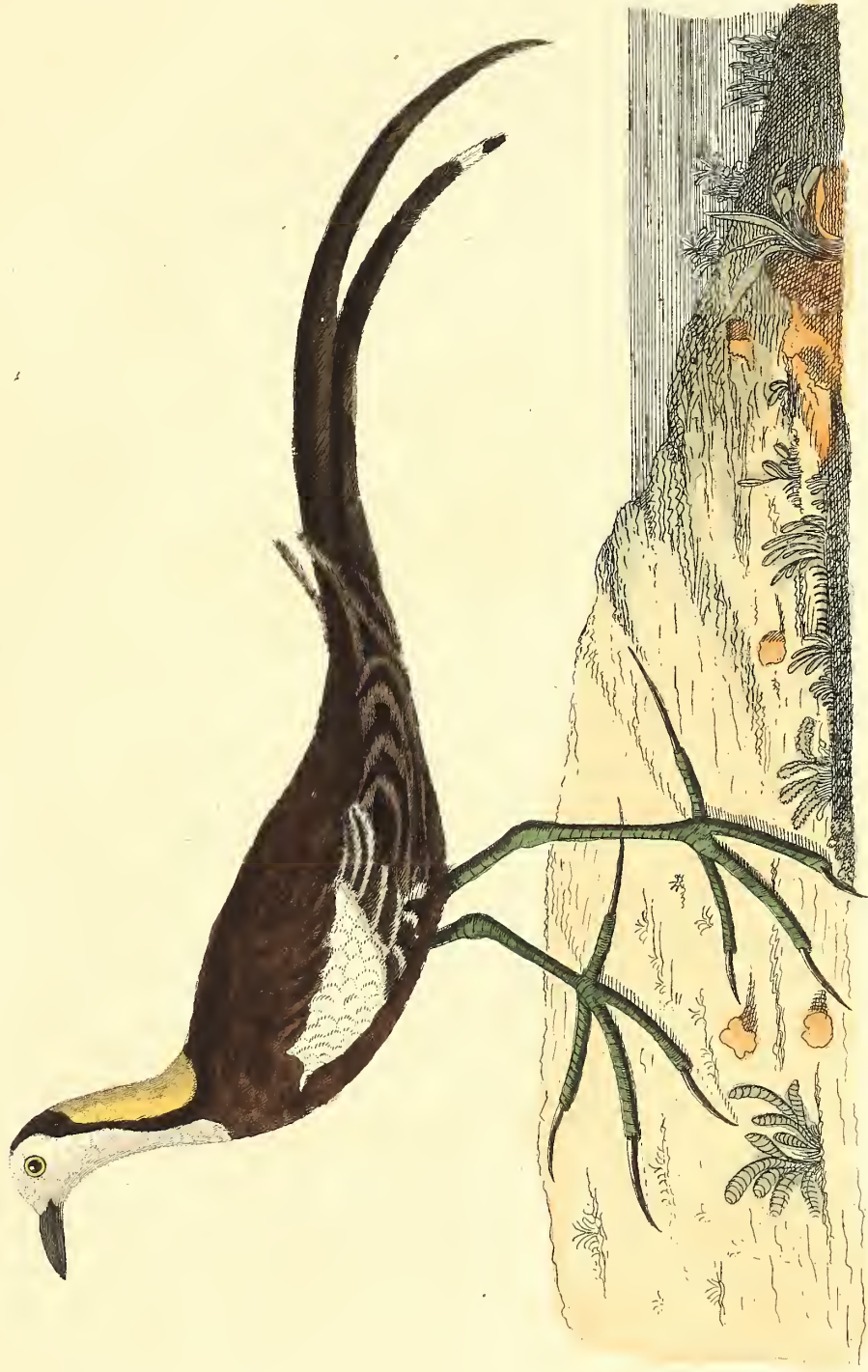
Der Chinesische Spornflügel