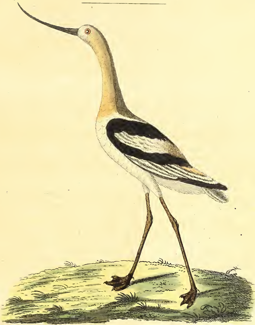
Der American: Säbelschnäbler.