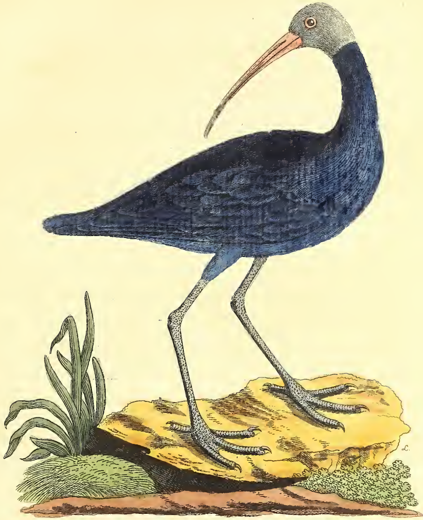
Der Weisköpfige Brachvogel.