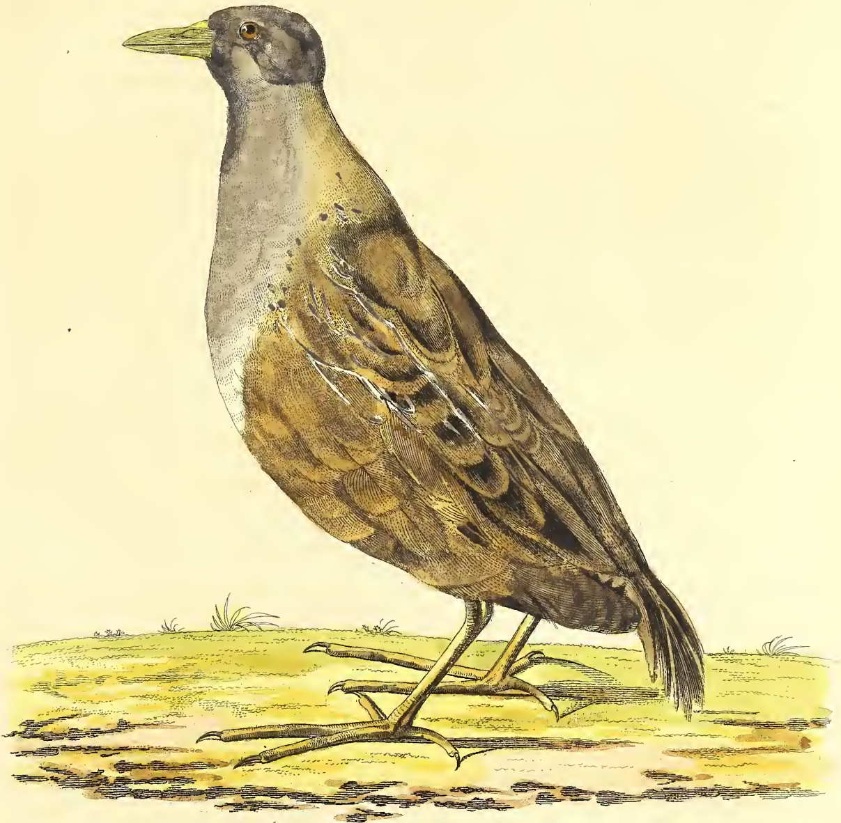
Das Carolinische Meerhuhn