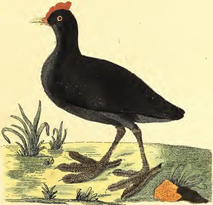
Das gekaubte Wasserhuhn.