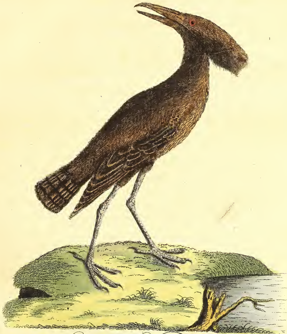
Der gehäubte Schattenvogel.