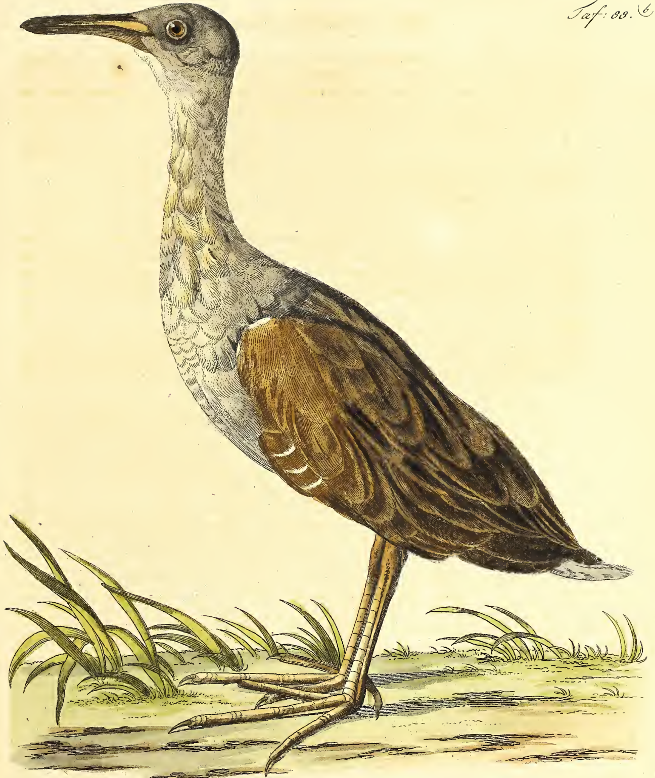
Die Virginische Ralle