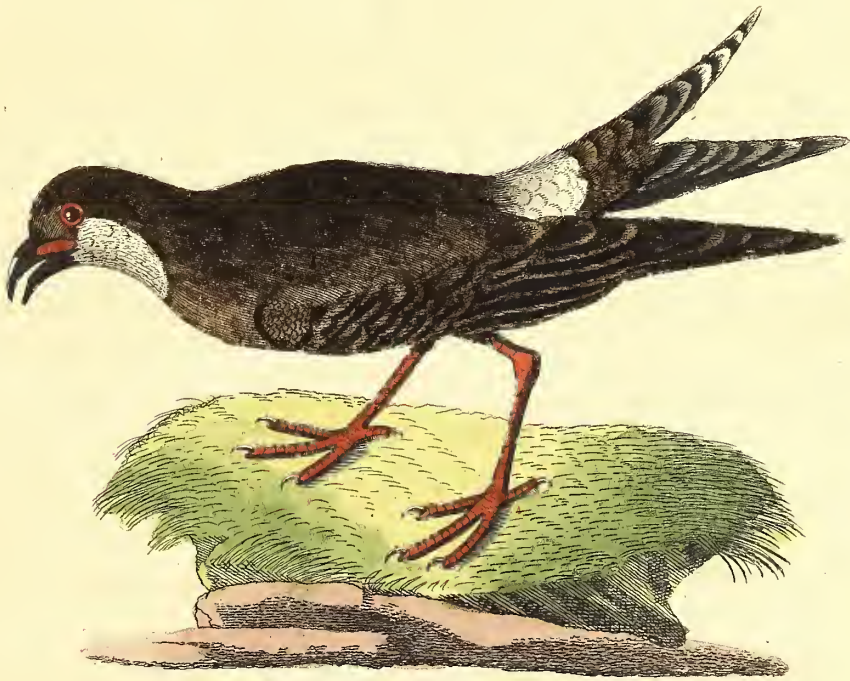
Das Oestreichsche Sandhuhn.