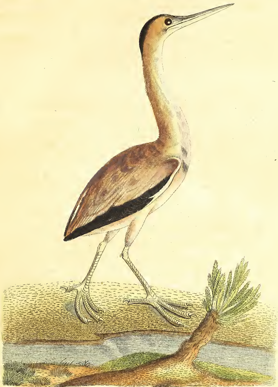
Der schwarzflügelige Rohrdommel