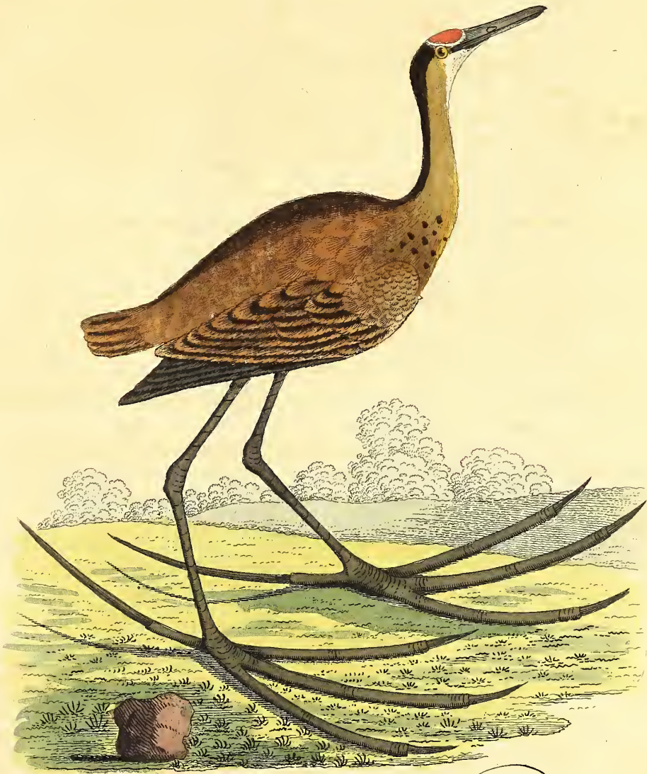
Der African: Spornflügel.