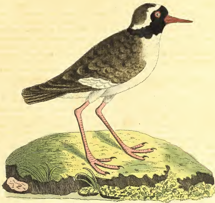
Der Neuseeländische Regenpfeifer.