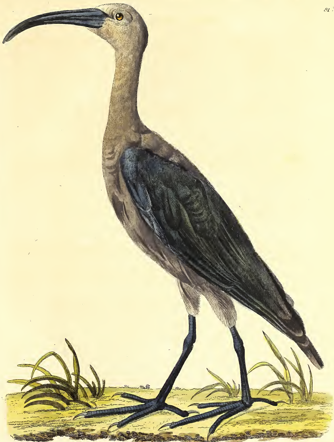
Schneberger pinxit Der sichelschnäblige Ibis. das Weibchen?