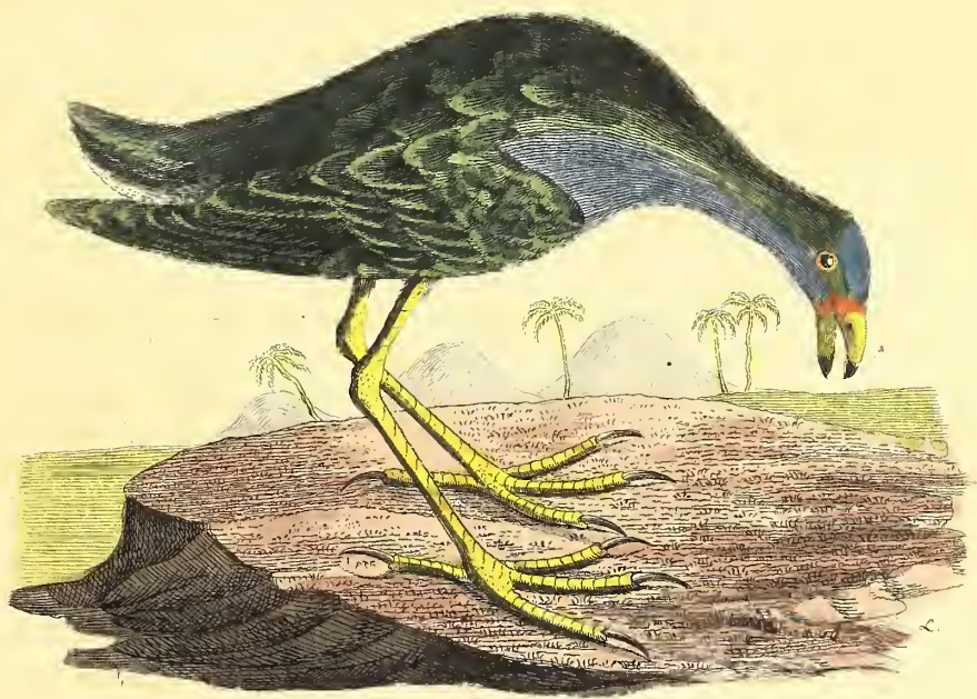
Das Martinikische Meerkuhn