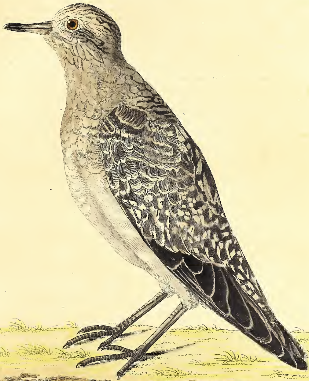
Der Virginische Regenpfeifer -