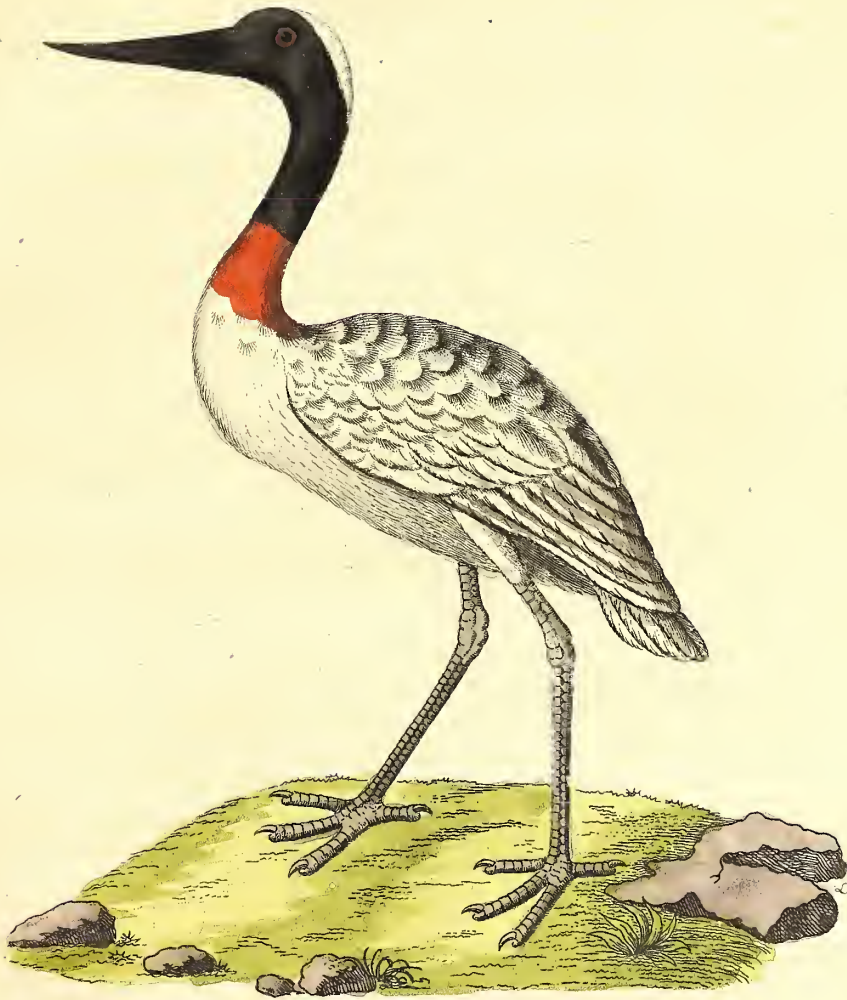
Der Americanische Fabiru.