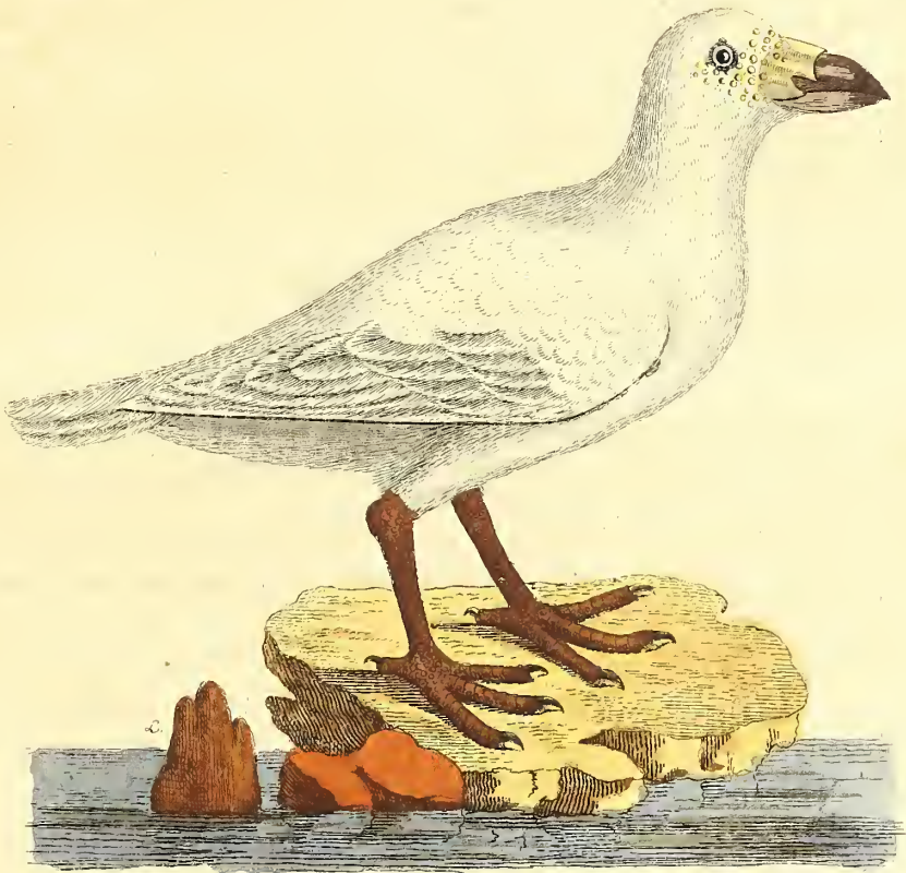
Der weiße Scheidervogel