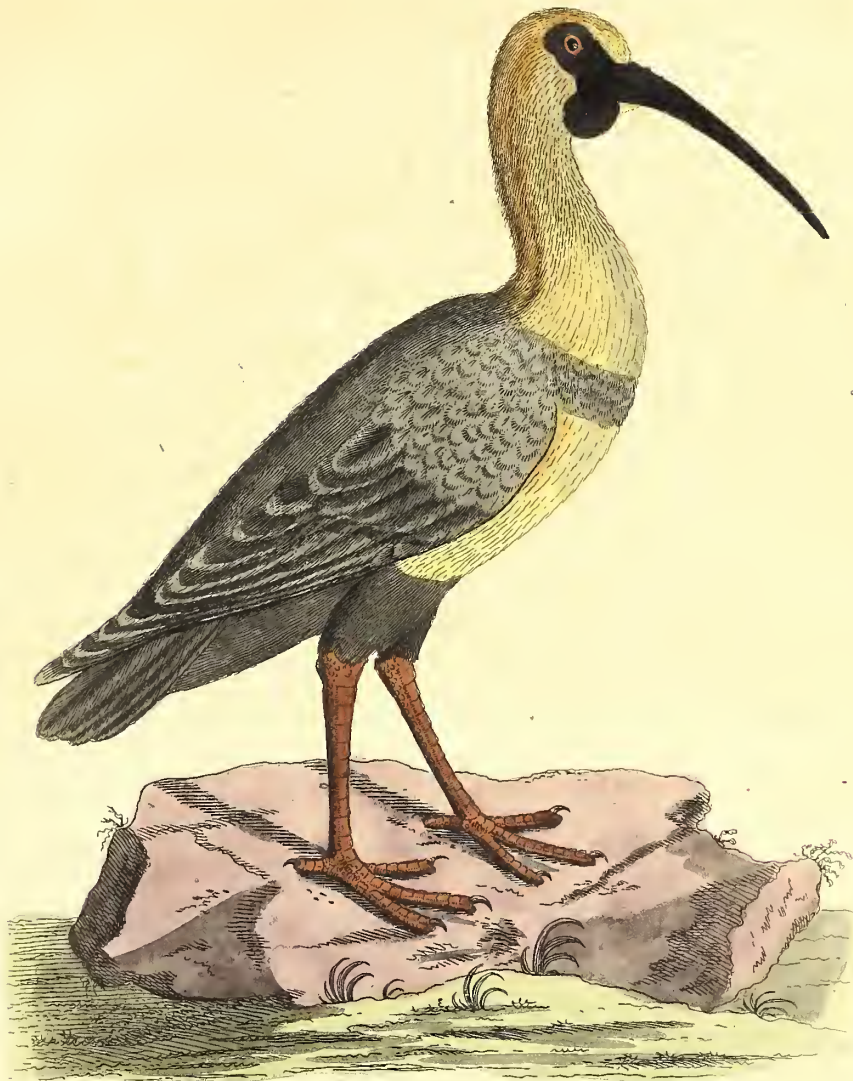
Der Ibis mit schwarzen Gesicht.