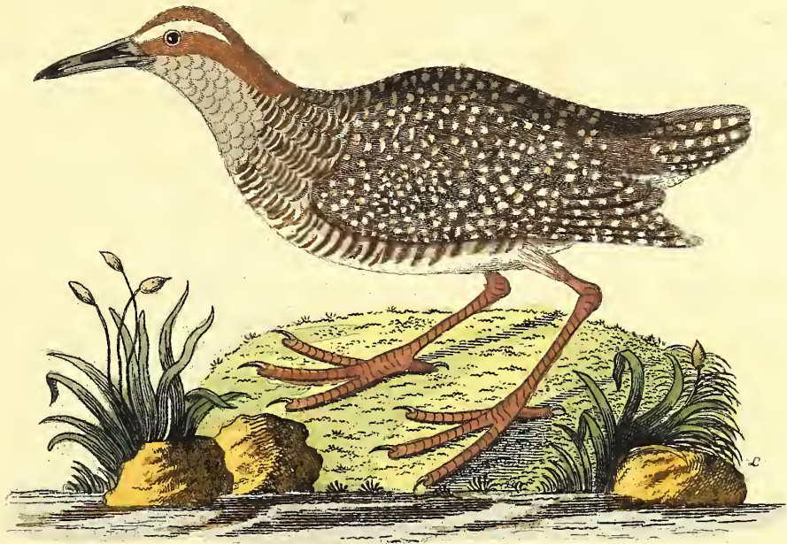
Die braunköpfige Philippinische Pötte.