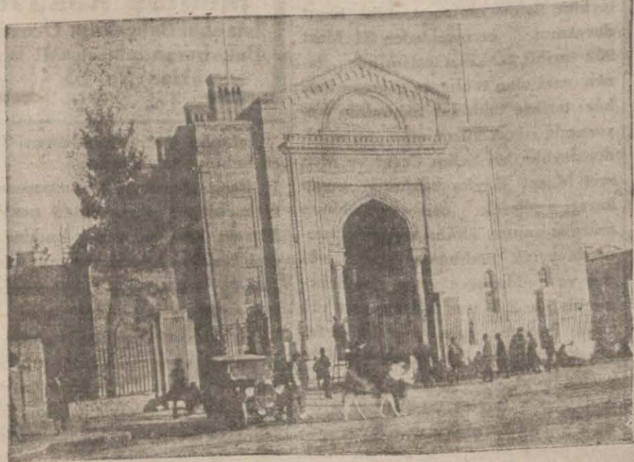
Banki Şehinşahiyyi İranın merkezi idare kapısı

Sağdan soldan birer kadın gelirse yoldaki erkek ne yapar?