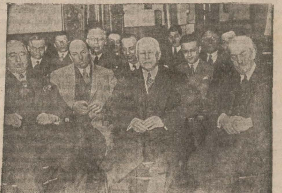
Dün Halkevinde toplanan doktor operatorları.

Çeşme civarında vakalanan Yunanlı balıkçılar Çeşme asliye ceza mahkemesinde muhakeme ve ikisi on beş güne, diğerleri de birer aya mahkûm edilmiştir.