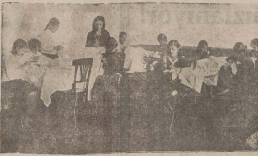
Geyvede Kâzım Paşa Mektebi dikiş ve nakış dersleri

Divan.. denilen beşer, onar evlik köy şeklinden vazgeçmek lâzımdır