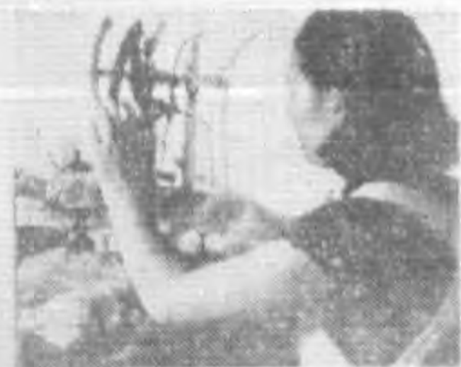
織度驗 (七) (一之驗檢質品)