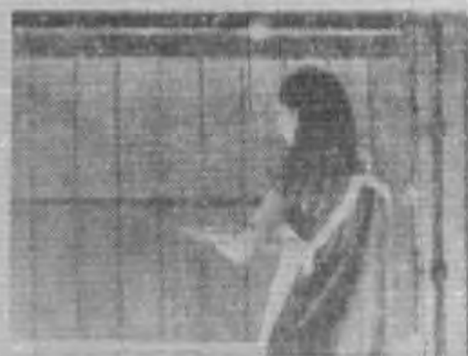
黑板驗 (八) (二之驗檢質品)