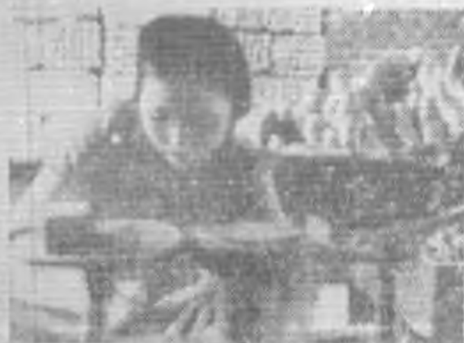
絲稱 (六) (二之整理)