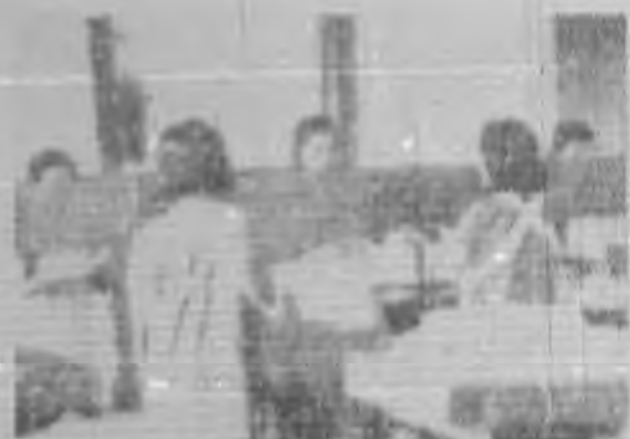
絲紋 (五) (一之整理)