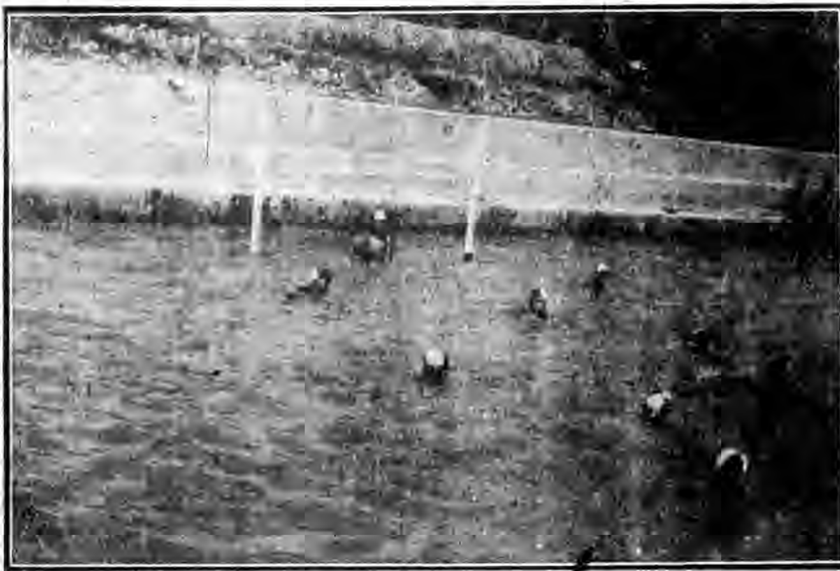
練營兵士練習水球攝影