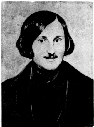
果 戈 理