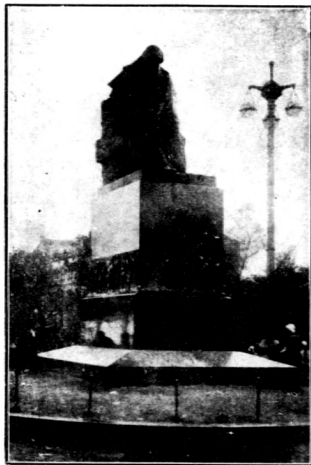
果戈理紀念石像 在莫斯科果戈理花園內