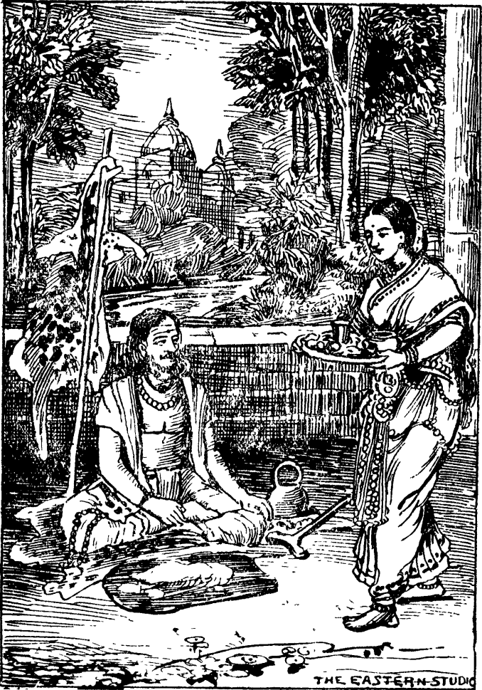
சுபத்திை அருச்சுனனே உபசரித்தல்