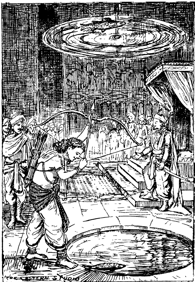
அநுச்சுளம் இலக்து எய்தல்.