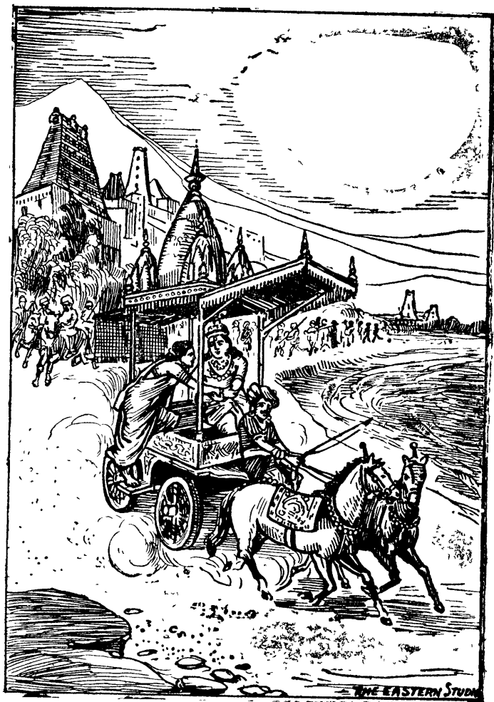
கிருஷ்ணன் ருக்மிணியைக் கவர்தல்