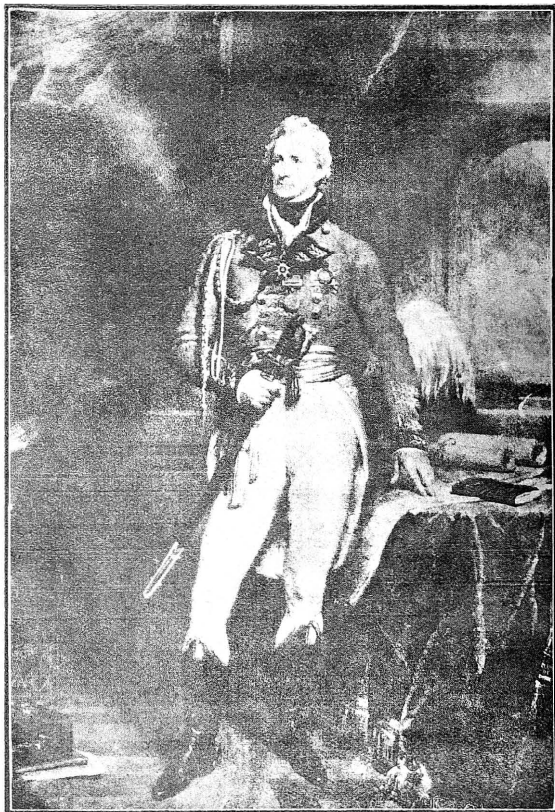
ஸர் தாமஸ் மன்ரோ.