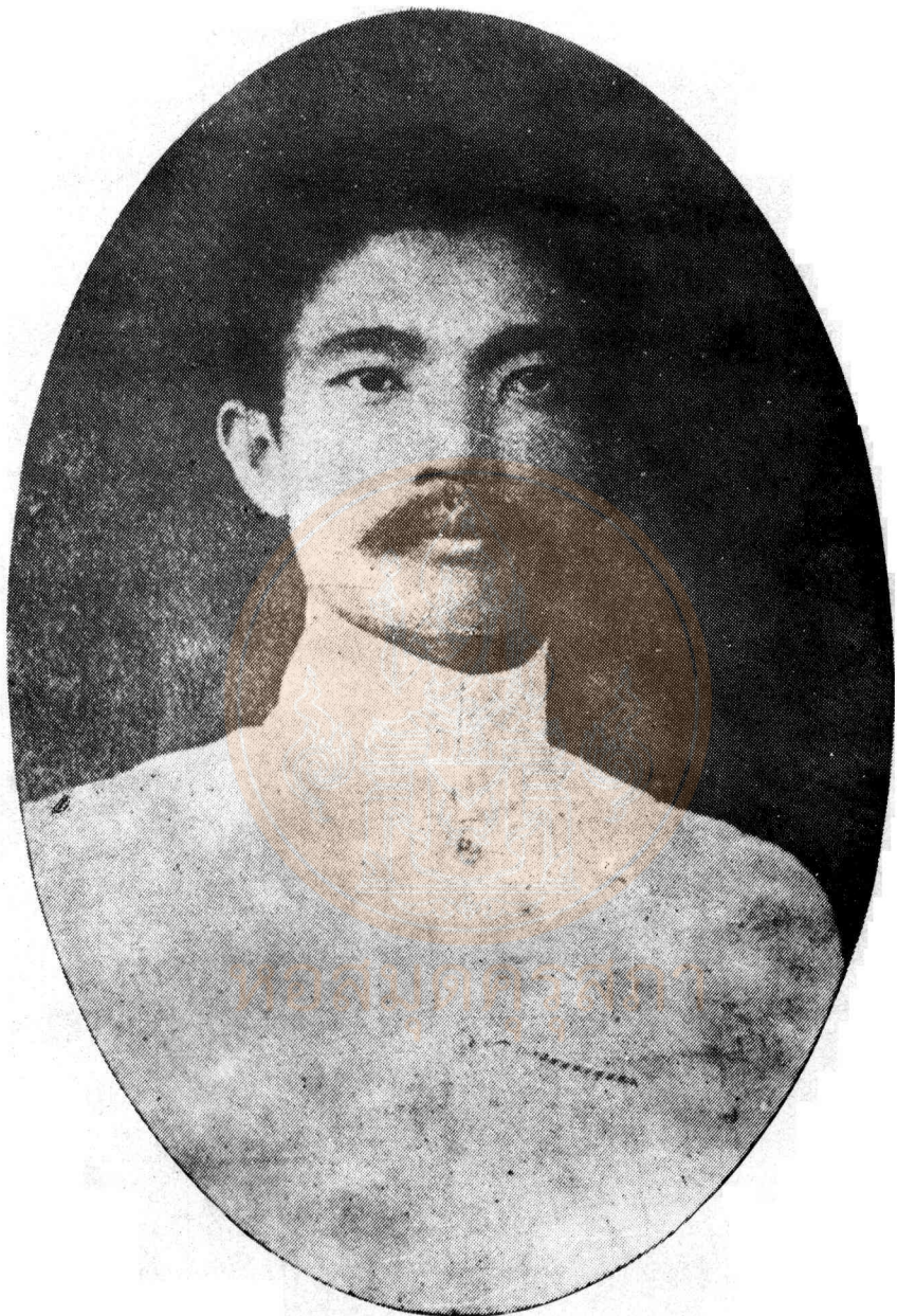
พระยาเทพศาสตร์สถิตย์ (โห้ กาทดิษย์)