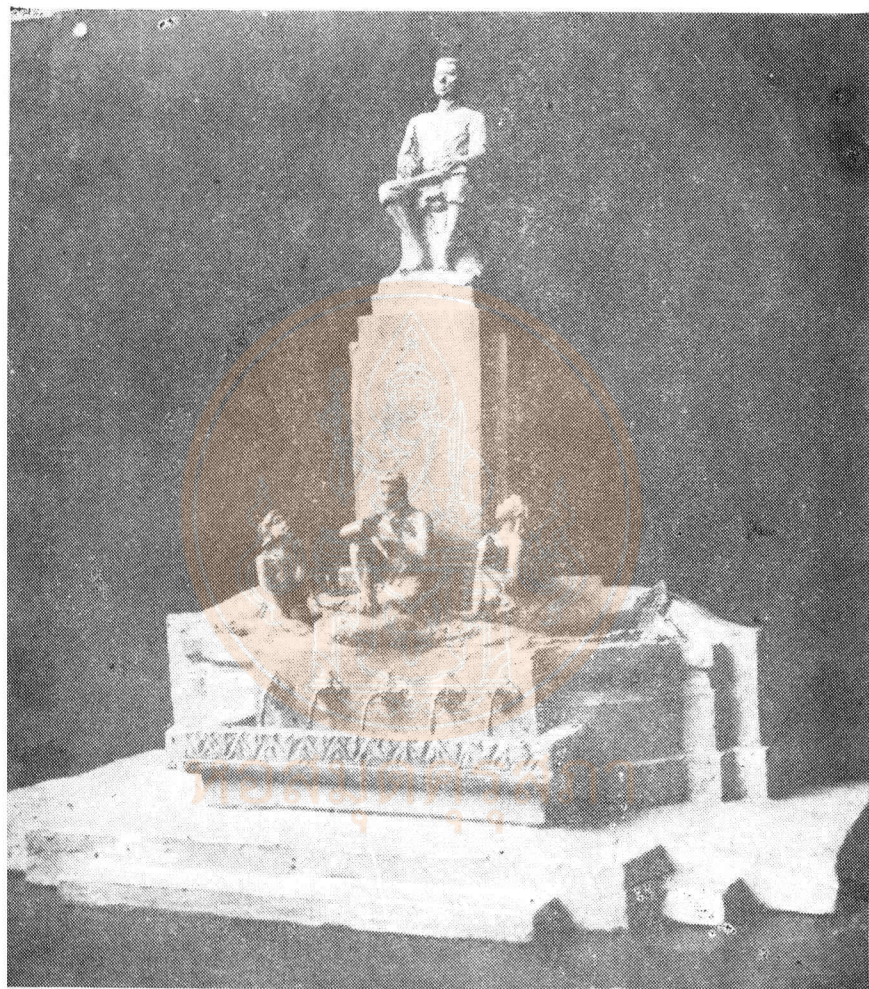
พระสุนทรโวหาร (ภู่) ถ่ายจากรูปปั้นของกรมศิลปากร