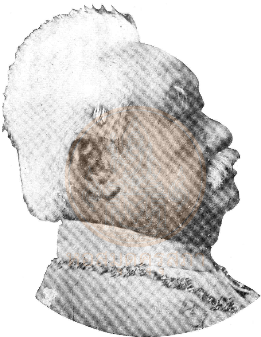
๗ เจ้าพระยาภาสกรวงศ์ (พร บุนนาค)