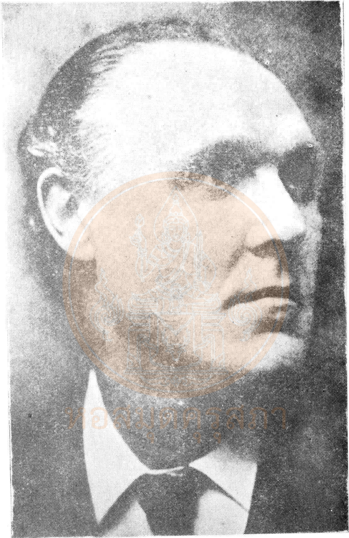
เซอร์โรเบิร์ต มอแรนต์