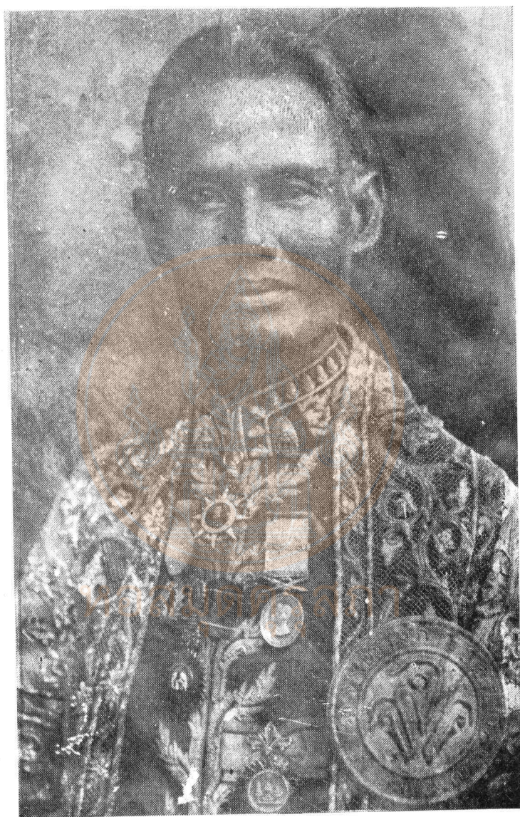
พระยาบรมบาทบํารุง (พิน ศรวัตรธนะ)