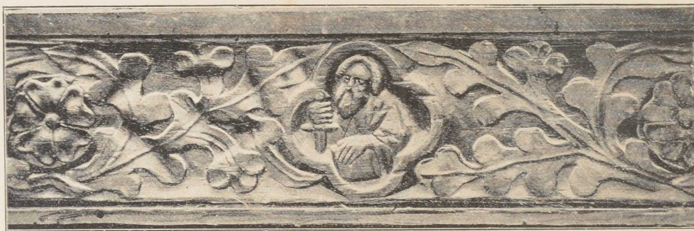
Schnitzwerk von den ehemaligen Chorschranken in der Kirche zu Gadebusch, jetzt in der Königs-Kapelle.