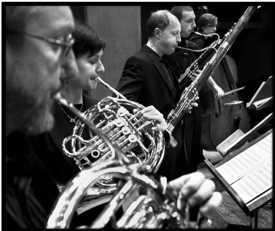
I Solisti del Vento