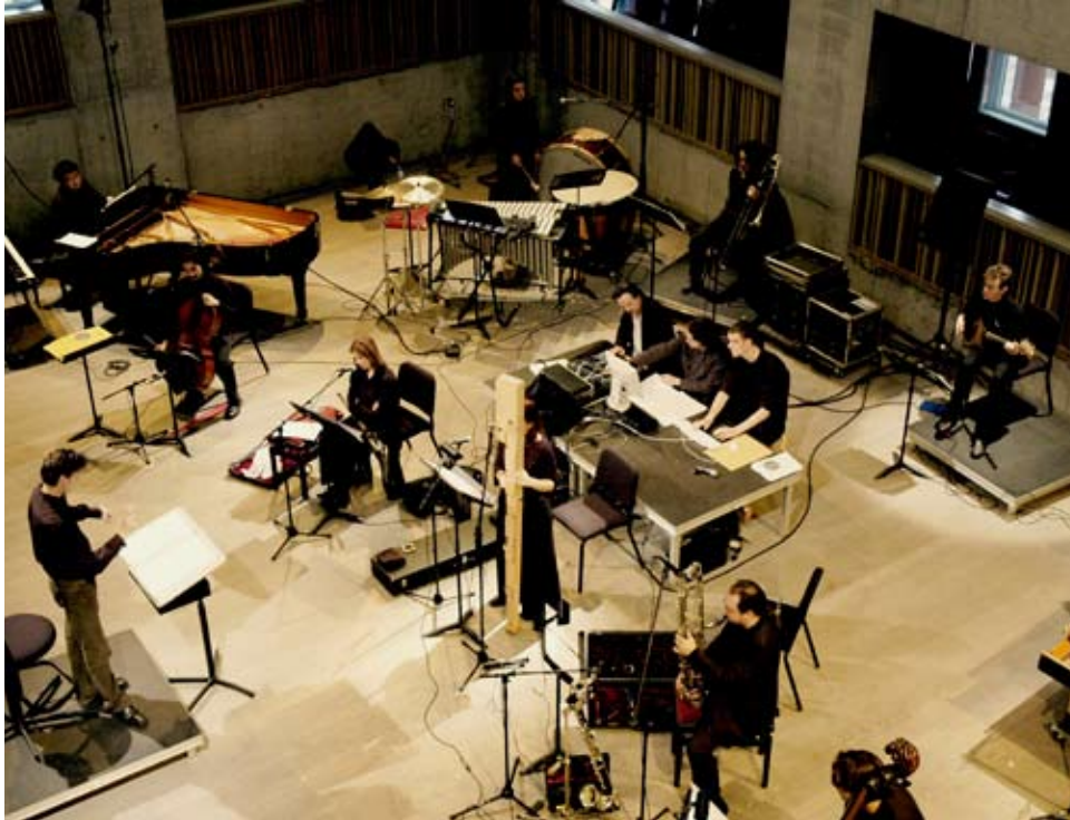
Champ d'Action © Bart Verstockt