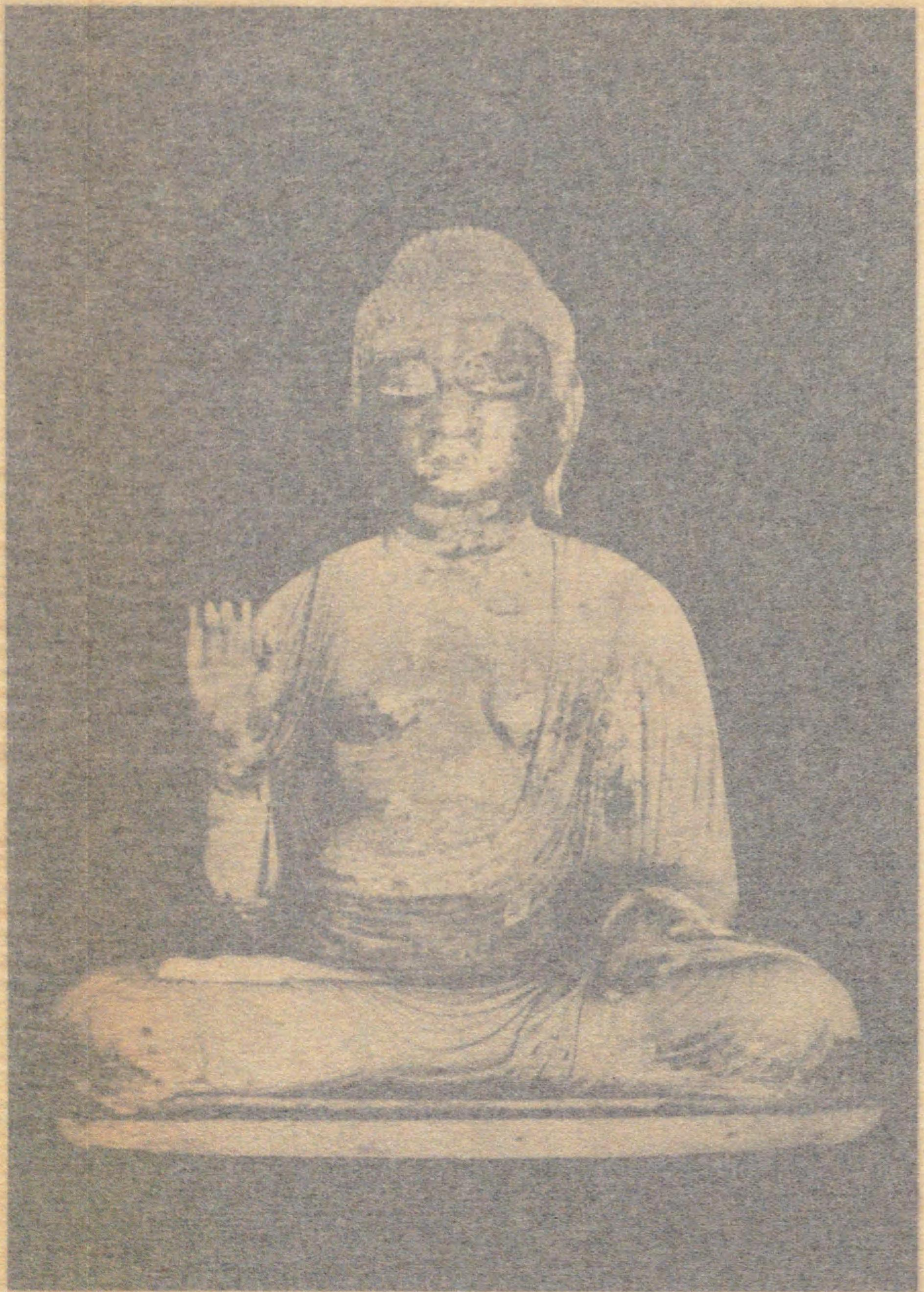
和泉泉南輝興善寺安置