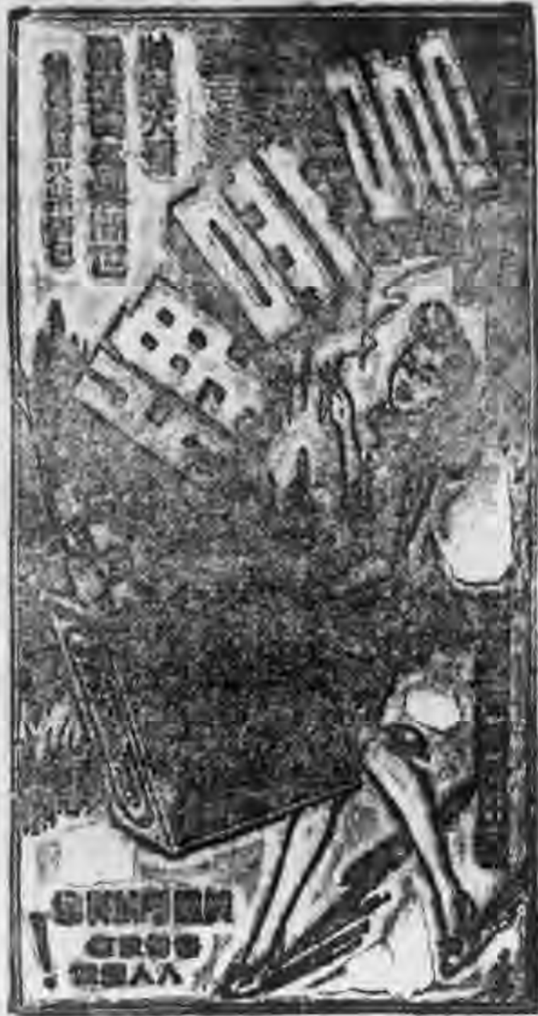
漢口總經理處(大舞合陽號)新成里三號