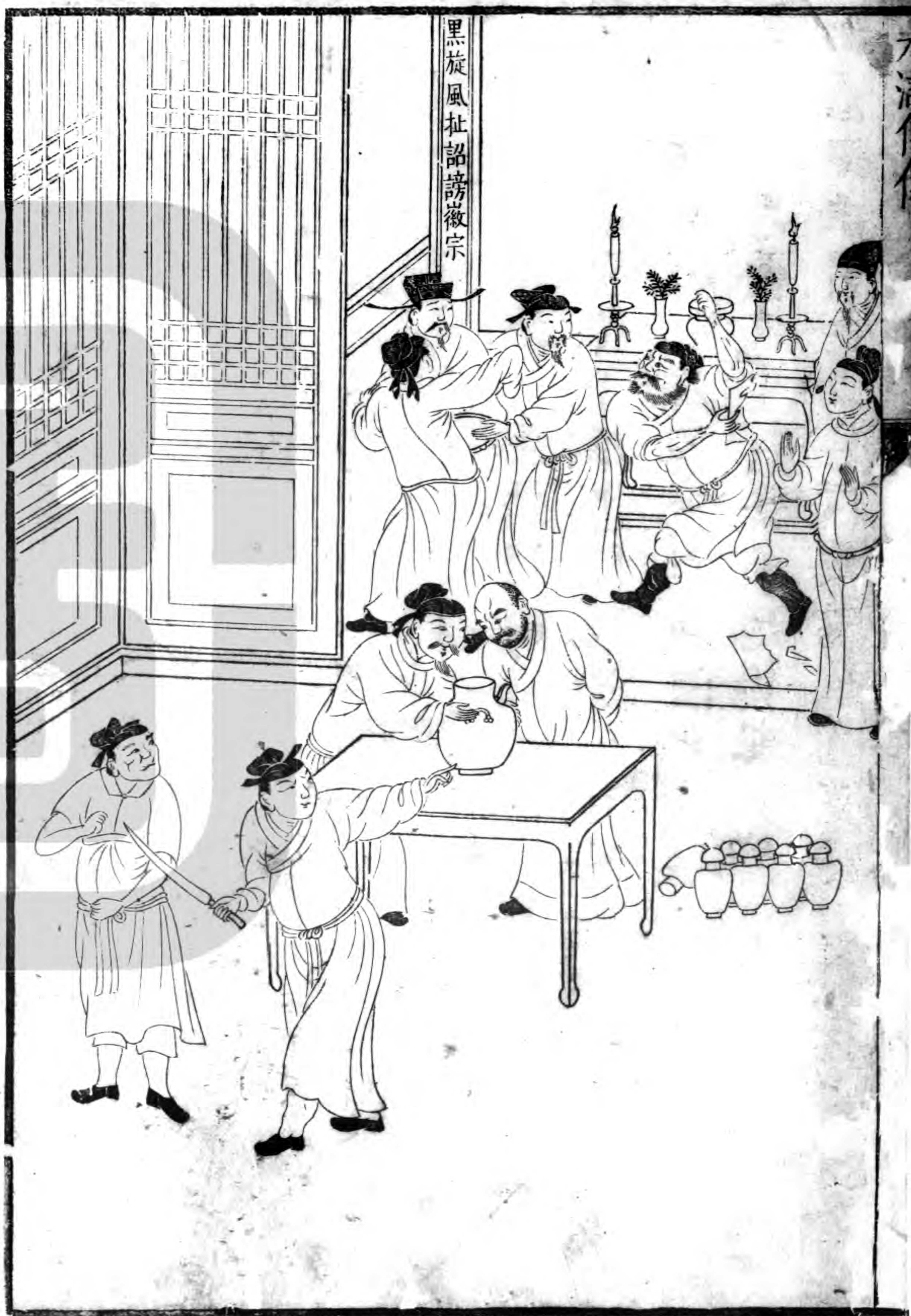
黑旋風扯詔謗徽宗