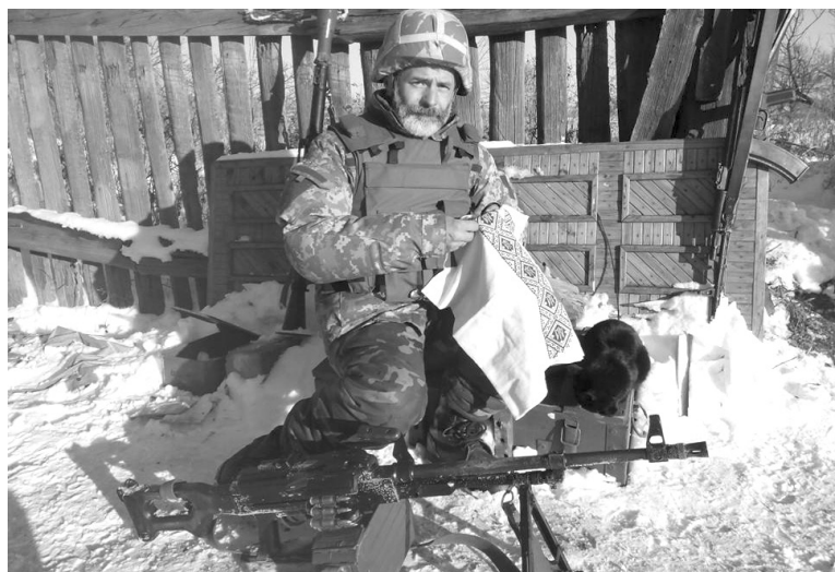
Новий образ Мамай