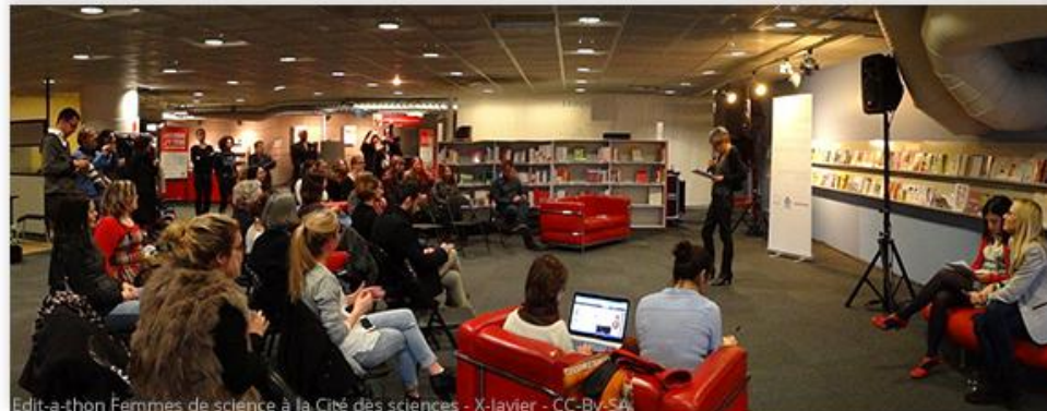
Edit-a-thon Femmes de science à la Cité des sciences

(en partenariat avec la Fondation L'Oréal)