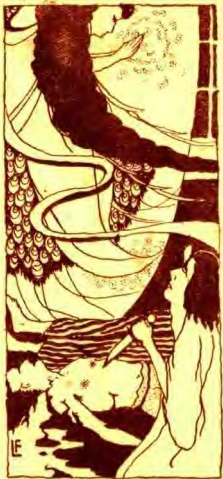
笑微地謝感中血紅在眼的麗美