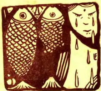
魚 雙 這 啊