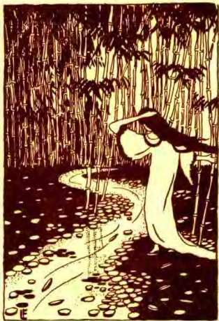
中 溪 看 望 然 凄