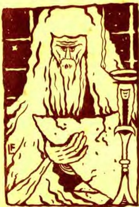
起擊紙信把手雙的枯乾