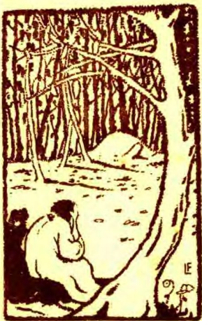
他手捧着頭動也不動