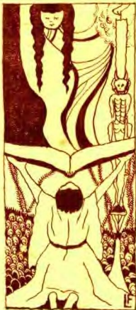
人友的裏夢給獻呈