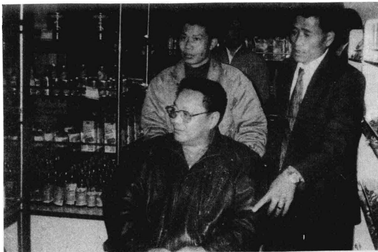
鄧樸方視察福建省助殘促進會“愛心系列工程”