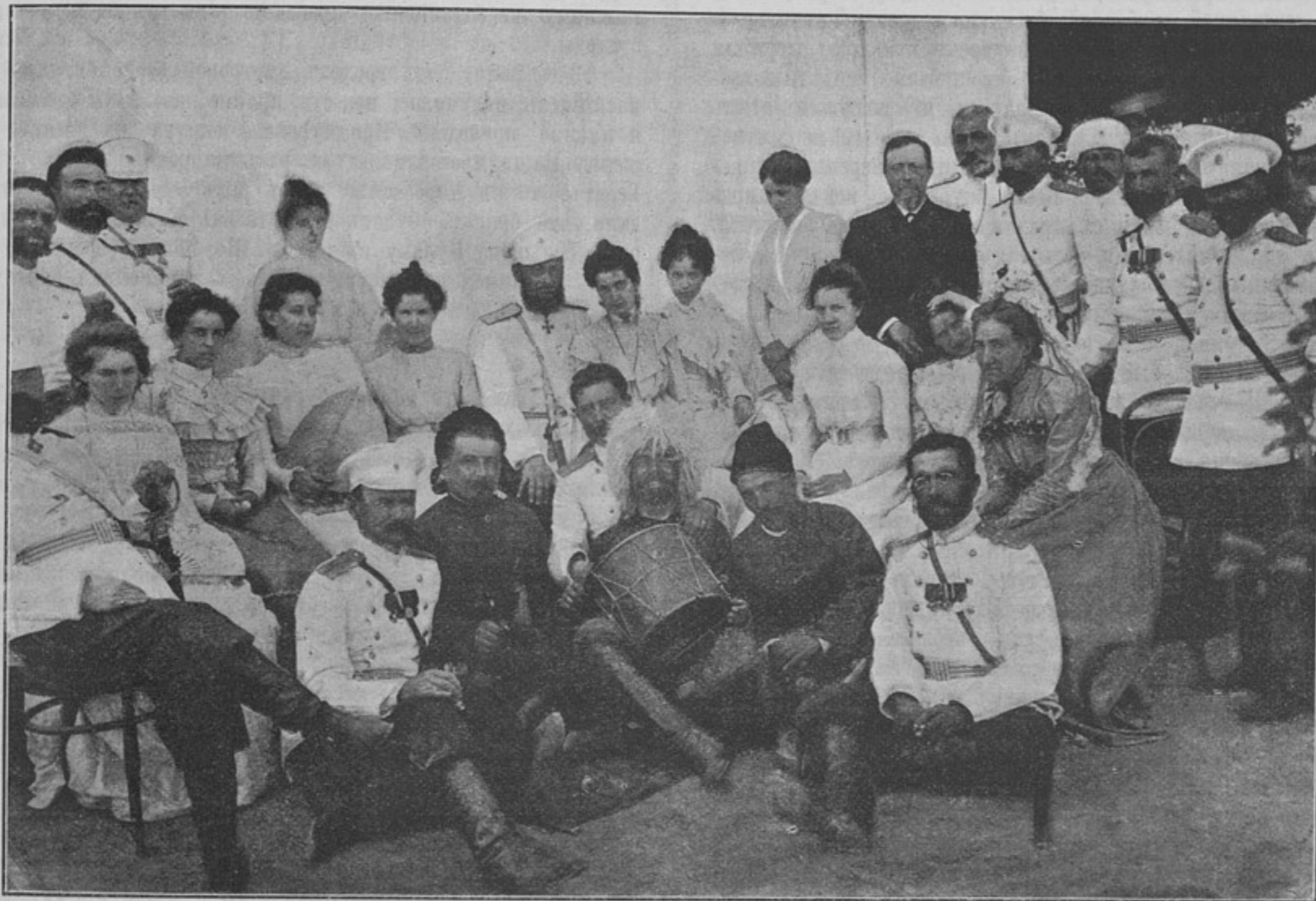
Группа снятая послѣ прощальнаго обѣда (къ статьѣ «Кавказскіе стрѣлки за Каспіемъ»).

29-го числа офицеры 4-го баталіона встрѣтили и привѣтствовали радушнымъ обѣдомъ, со всѣми кавказскими аксесуарами, офицеровъ 8-го Закаспійскаго стрѣлковаго баталіона, прибывшаго на лагерную стоянку. Въ этотъ же день, необычайно жаркій и душный, къ намъ пріѣхали гости: 8 дамъ и много мужчинъ. Пили чай на воздухѣ. Затѣмъ впереди лагеря были организованы солдатскія игры съ призами. Въ 9 часовъ, по сигнальному призыву «кот-ле-та», «кот-ле-ты» *), общество собралось у столовъ, обильно уставленныхъ разнообразными яствами. Хоръ гурійцевъ, чередуясь съ музыкой, временами прерывался веселыми, душевными тостами и пожеланіями; послѣ каждаго тоста слѣдовалъ залпъ холостыми патронами. Часовъ въ 11, къ намъ примкнули офицеры 4-го баталіона съ своими гостями и съ зурной. Вплоть до разсвѣта шла пляска и раздавались кавказскія пѣсни. Жажда наша была столь велика, что 300 бутылокъ лимонада и 120 бутылокъ пива едва могли ее утолить. Кахетинскому же вину кавказцы счетъ не ведутъ.