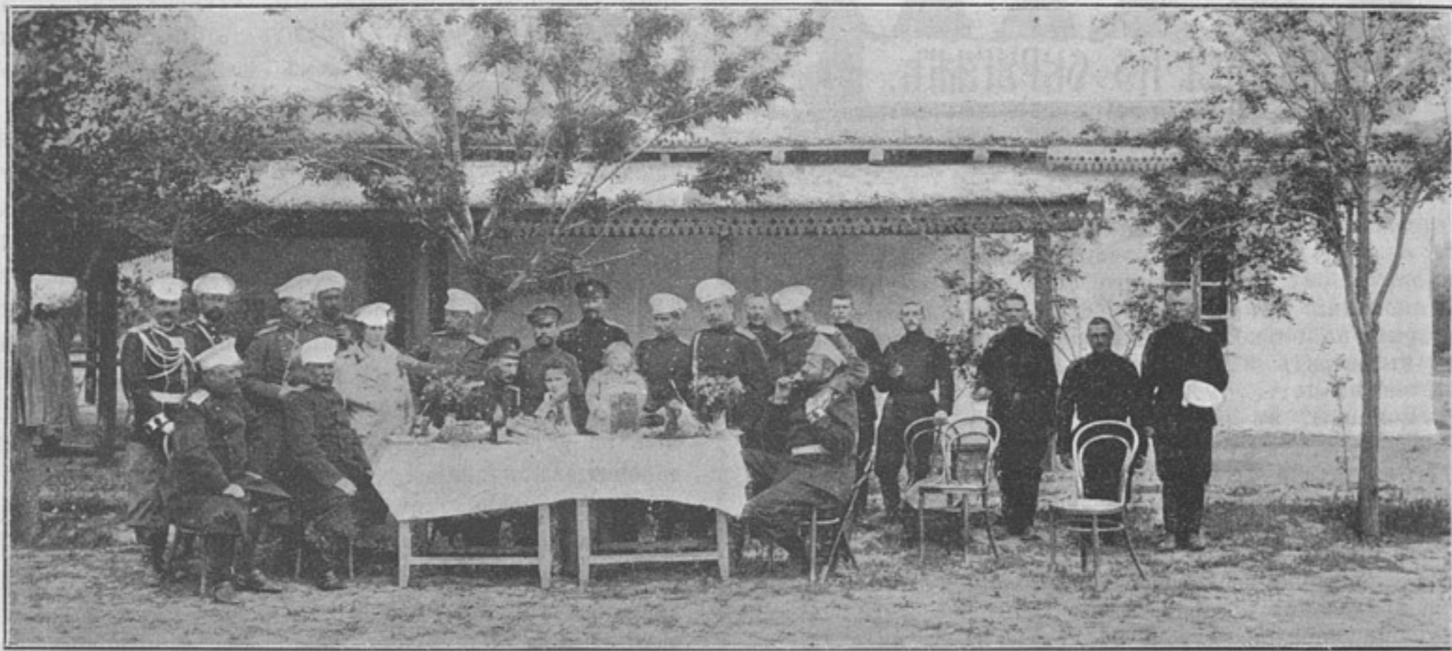
Пасхальный столъ въ Акъ-Теле (къ статьѣ «Кавказскіе стрѣлки за Каспіемъ»).

При крайней быстротѣ мысли и необыкновенно скоромъ воздѣйствіи желаній, дѣйствія и поступки его были необыкновенно быстры, порывисты и почти рефлексивны. Въ дѣлахъ серьезныхъ, требующихъ изученія, онъ отдавалъ этому процессу должное, но въ дѣлахъ малозначащихъ онъ дѣйствовалъ по первому порыву мысли и желанія. Чѣмъ Суворовъ становился старше, опытнѣе, заслуженнѣе, тѣмъ онъ дѣлался само-