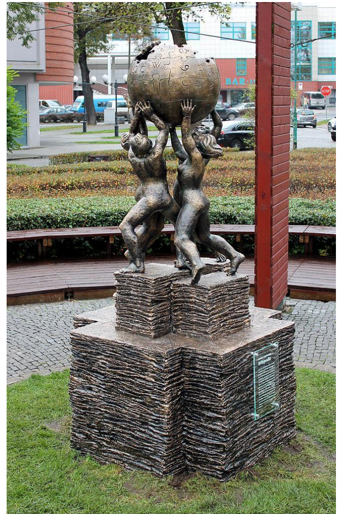
Пам'ятник Вікіпедії, м.Слубіце, Польща