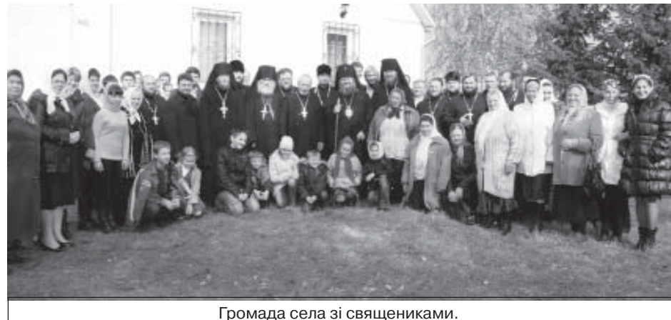
Громада села зі священниками.