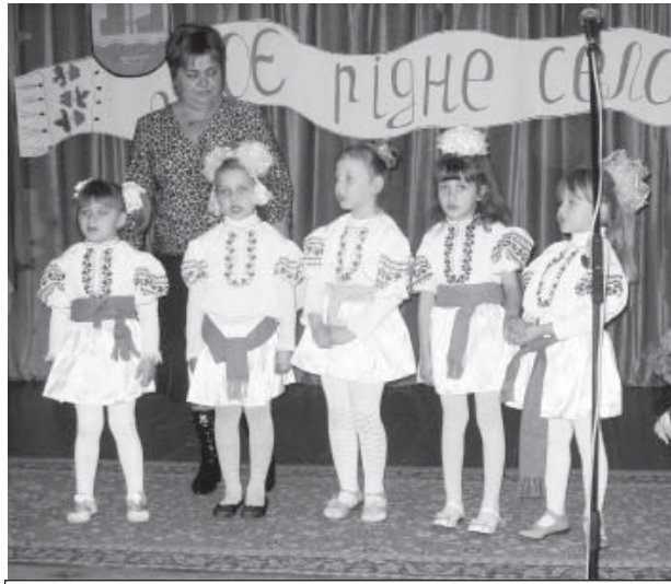
Вітання від дошкільнят.