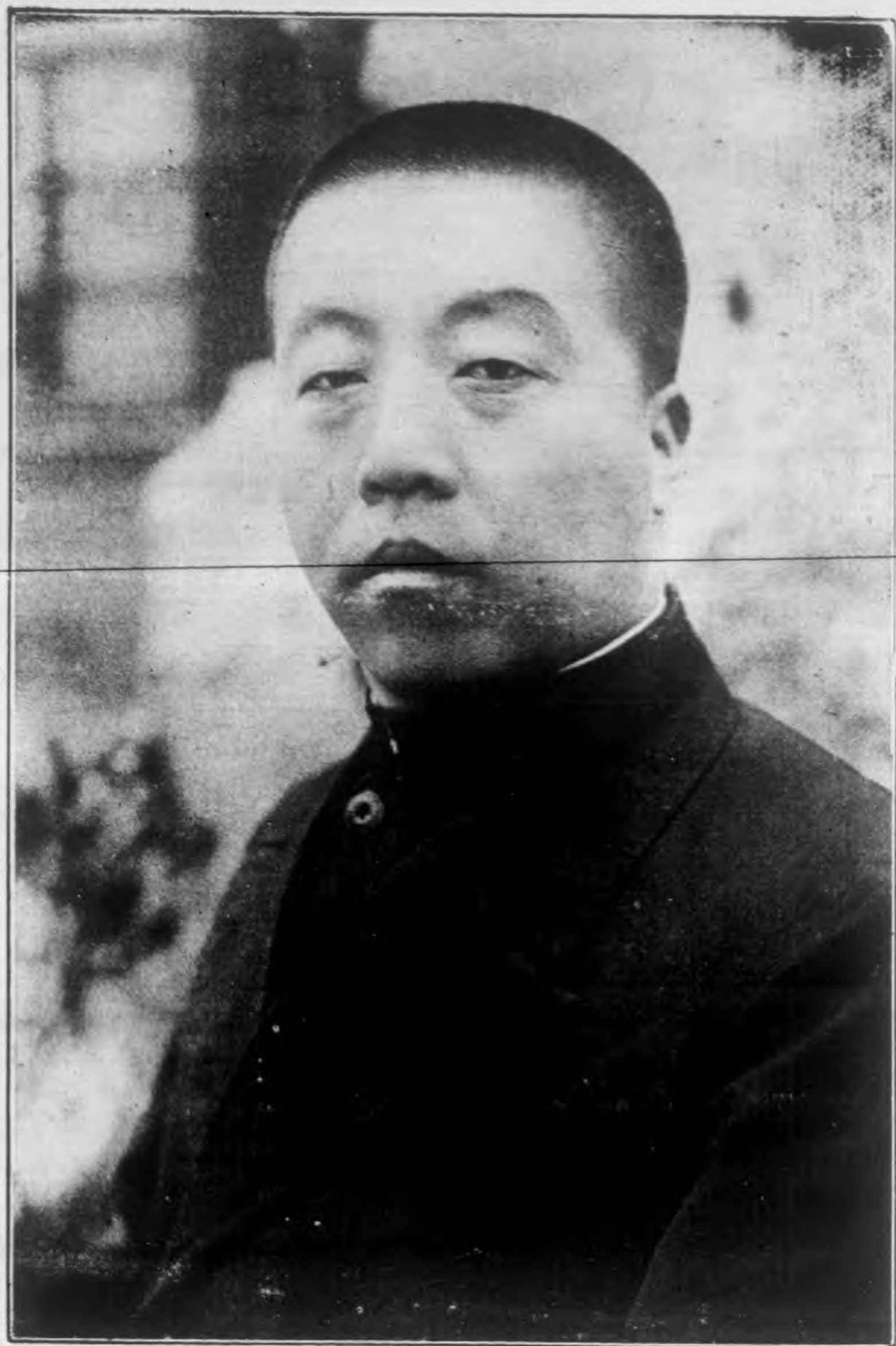
榮 向 王 長 廳