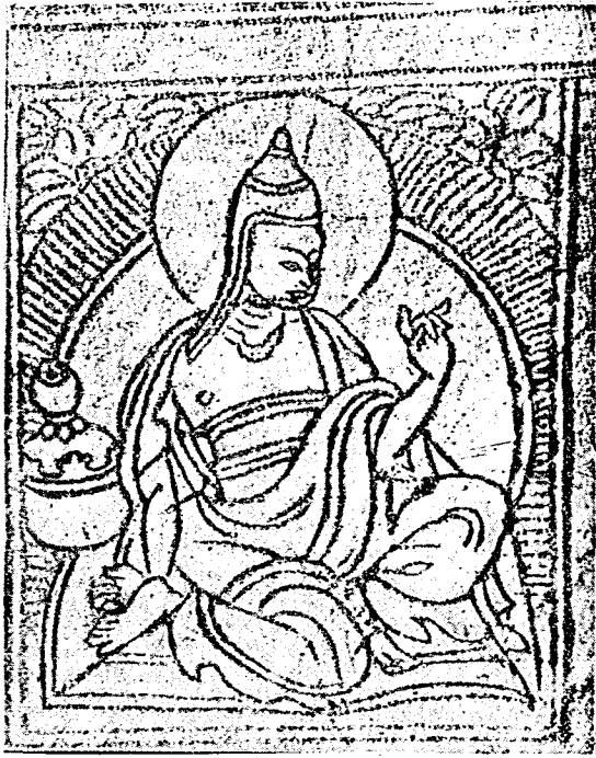
陳那菩薩畫像（刊奈且版論本左端）