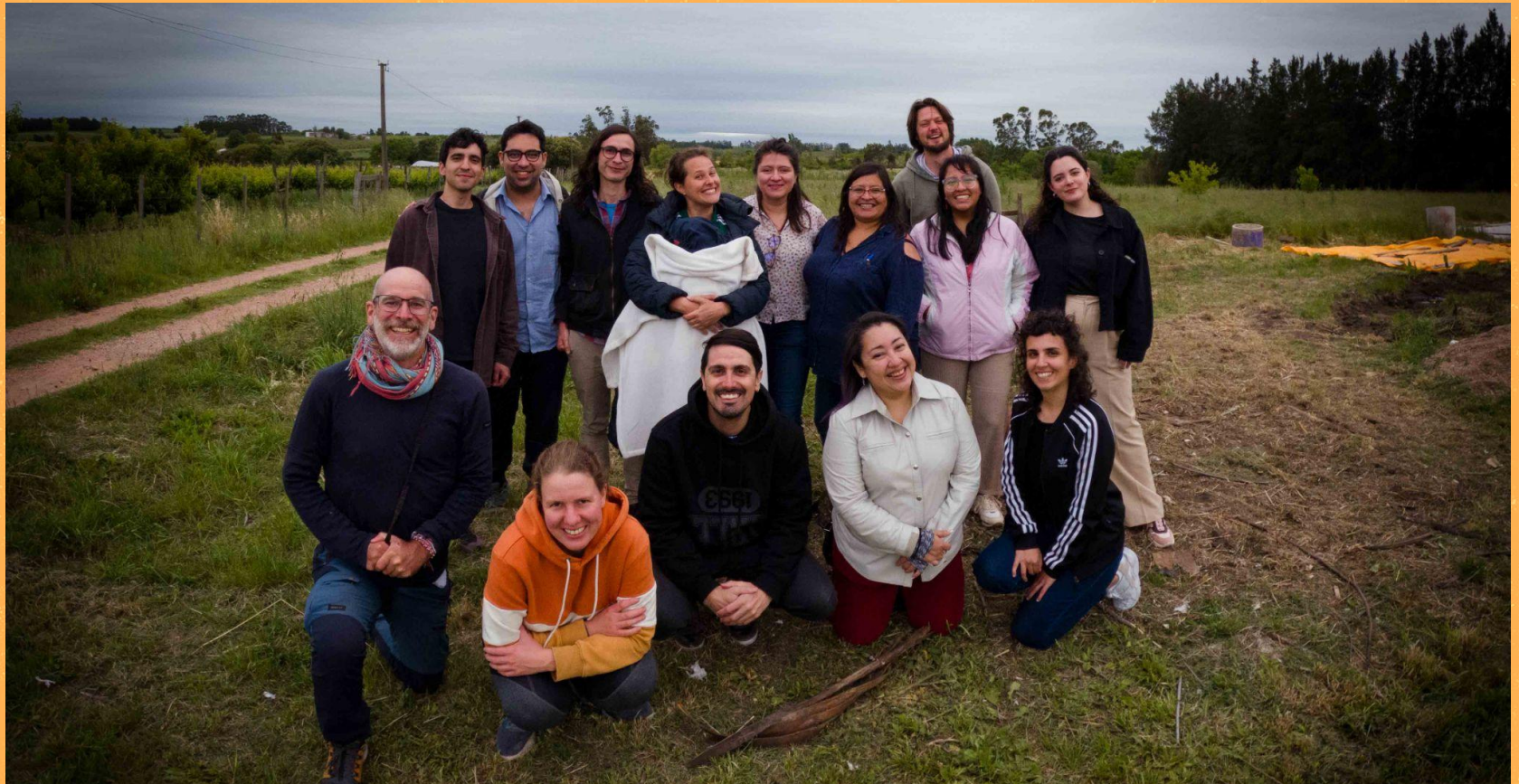
GLAM WIKI CONFERENCE 2023