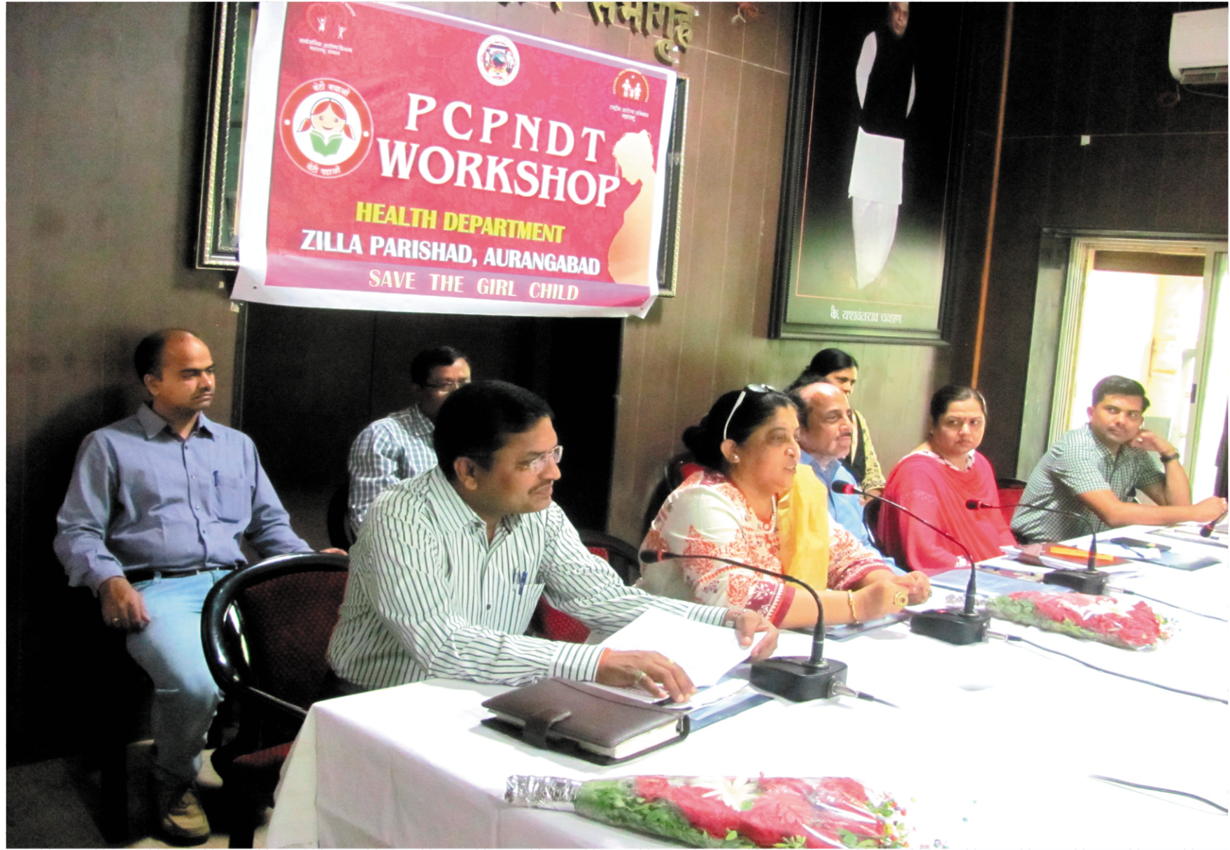
ग्रामीण आरोग्य, पोषण आणि स्वच्छता समिती सदस्यांचा प्रशिक्षण कार्यक्रम-यशवंतराव चव्हाण सभागृह जिल्हा परिषद औरंगाबाद