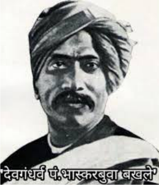
‘देवगंधर्व पं.भास्करबुवा बखले’

भास्करबुवा बखले, म्हणजे भास्कर रघुनाथ बखले हे मराठी हिंदुस्थानी संगीत परंपरेतले गायक, संगीतकार होते. त्यांचा जन्म सुरतजवळील कठोर या गावी झाला. फैजमहंमद खाँसाहेबांना १८९० पूर्वीच बडोदे सरकारने शाळा चालविण्यास जागा देऊन सर्व व्यवस्था केली होती. दरबारी गायक म्हणून त्यांना खर्चासाठी चाळीस रूपये महिना मिळत असे. त्याचबरोबर शाळेचे संचालक म्हणून अधिक चाळीस रूपये मिळत होते. उस्ताद फैजमहंमद