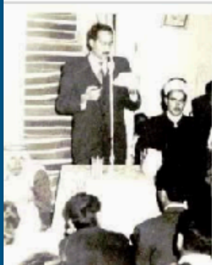
الشاعر ولید الأعظمي يلقي قصيدته في عام 1960