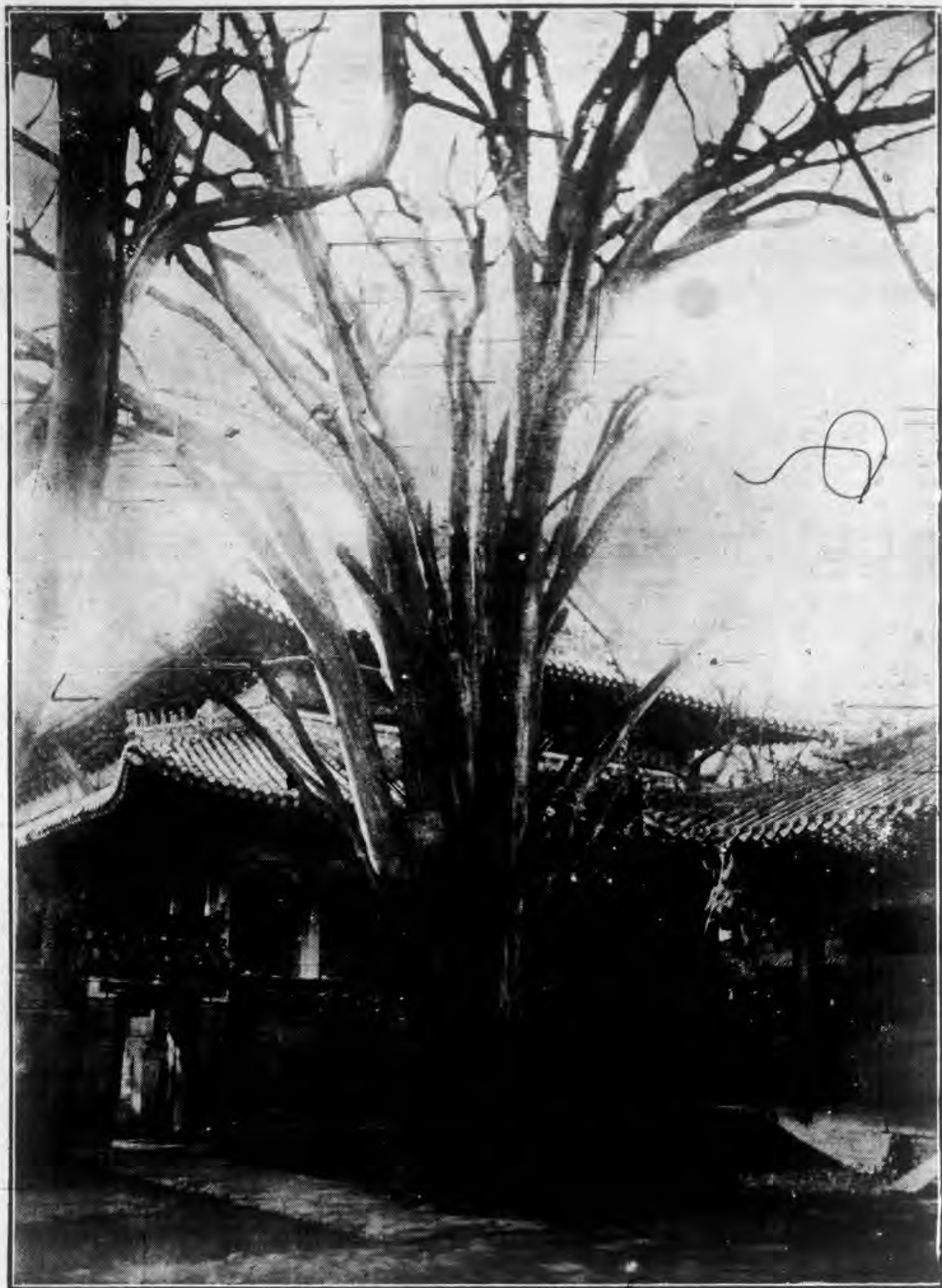
曲阜復聖廟白虎皮松