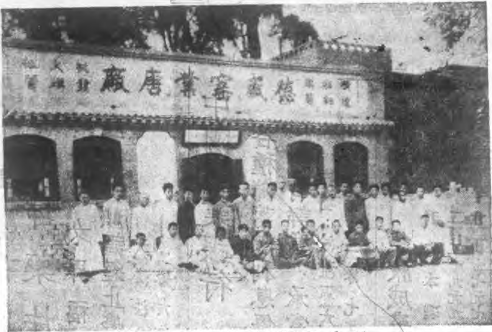
德盛窯業廠正面之圖