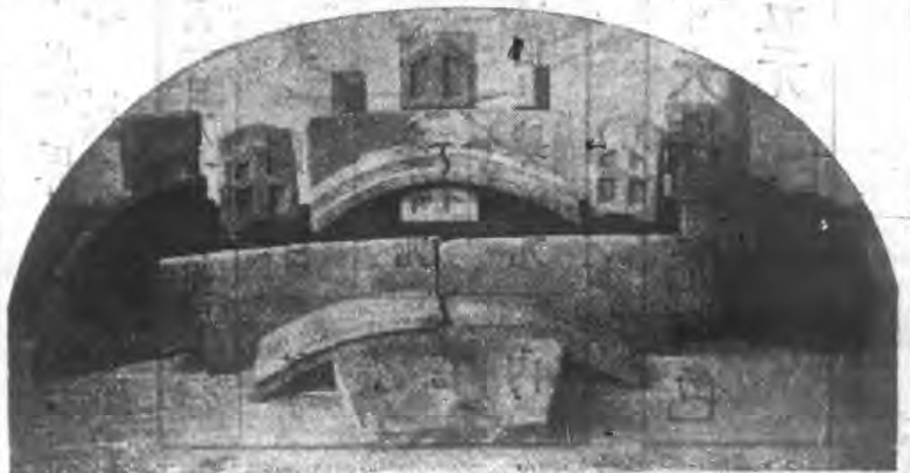
得勝牌耐火爐磚之圖