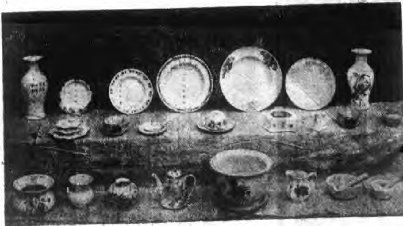
天津德盛窯業廠出品之一