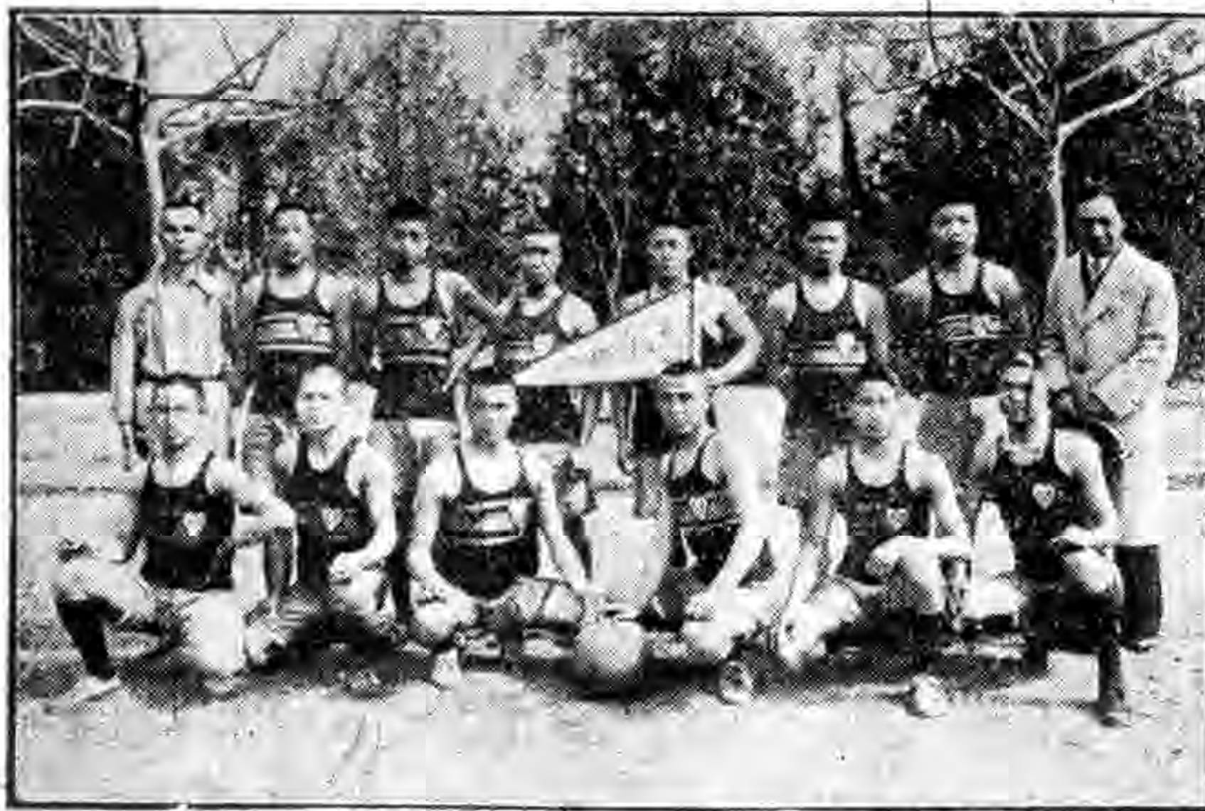
建康軍艦籃球隊攝影

海甯砲艇，十三日下午六時五分寄錫吳淞，十四日上午五時開行，午刻過和腦山燈塔，下午九時四十五分寄錫牛欄基，十五日上午五時開行，下午九時寄錫大滬，十六日上午五時開行，午刻過百菱，下午五時抵馬江，十八日下午四時抵黃