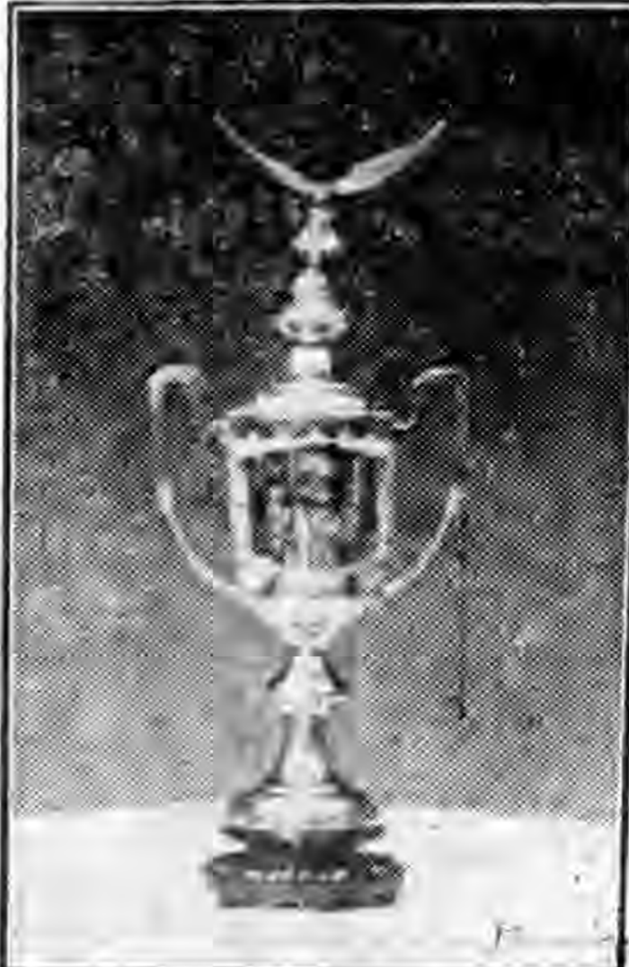
品獎之會動運屆一第營練 (足捷心雄) 杯銀長次務政 (三)

中央黨部於五日上午八時，舉行革命政府成立第十四週年紀念大會，黨部內外，事前均滿懸花綵及標語對聯等，