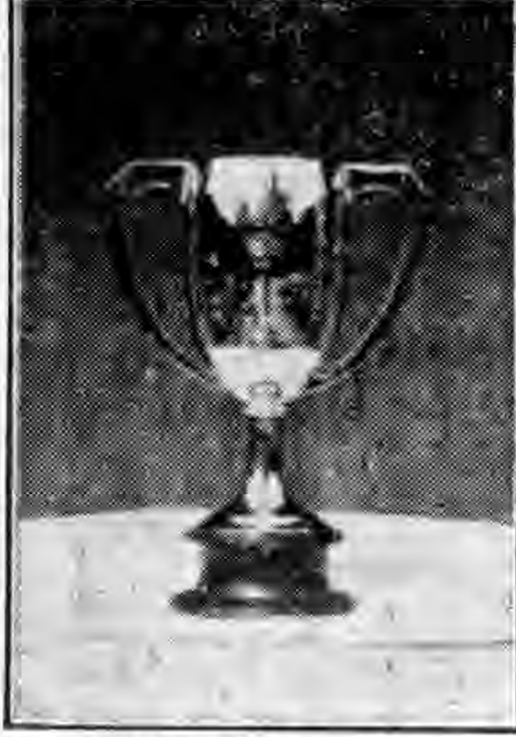
品獎之會動運屆一第營練 (流上爭力) 杯銀長次務常 (四)