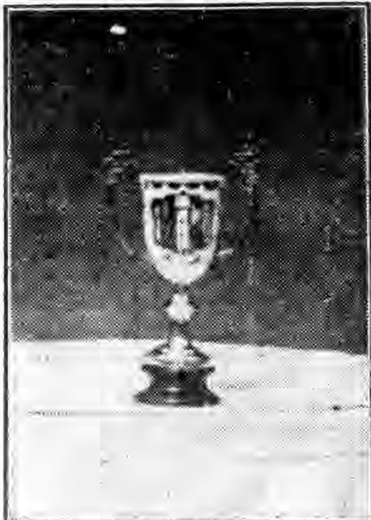
品獎之會動運屆一第營練 (國強身強) 杯銀贈會本(一)

陳司令率各艦北航操演，已紀前刊，續據報告，陳司令率艦抵烟台後，按日繼續飭令各艦操演，五月五日陳司令本擬拂曉率各艦開行，嗣以是日上午濃霧延至午刻十二時，始率甯海等十一艦，離烟台出發，沿途仍操演船陣，下午五時四十分同抵廟島，六日上午九時半，陳司令率甯海應瑞兩艦，離廟島開行，約有十八海里之程，其地為大小鼠兩山附近演放魚雷，甯海左雷兩出，射程各定一萬密達，右雷兩出，射程各